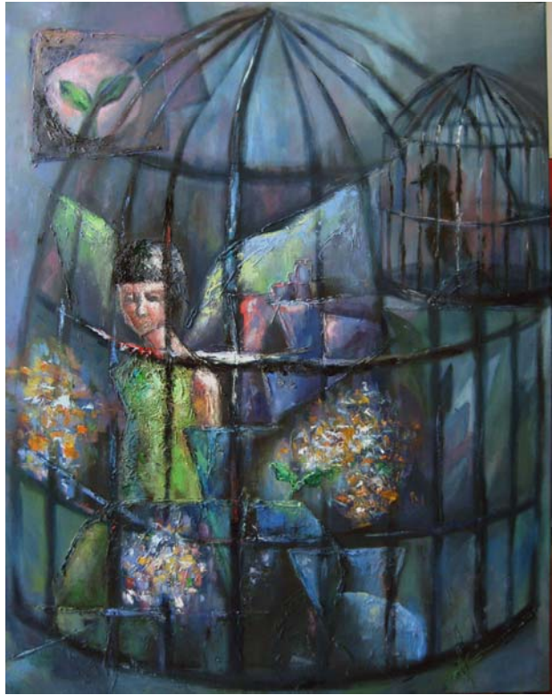
陳惠君 蟄伏等待 油彩·畫布 116.5 × 91 cm 2007

乍看之下，畫面中的人物，張著翅膀，狀似被關在籠中，似乎是外在環境的限制，讓人不能自由的展翅飛翔，就像被困住的鳥，人生總不免遇到困頓的時刻，走進死胡同，繞來繞去找不到路，迷失