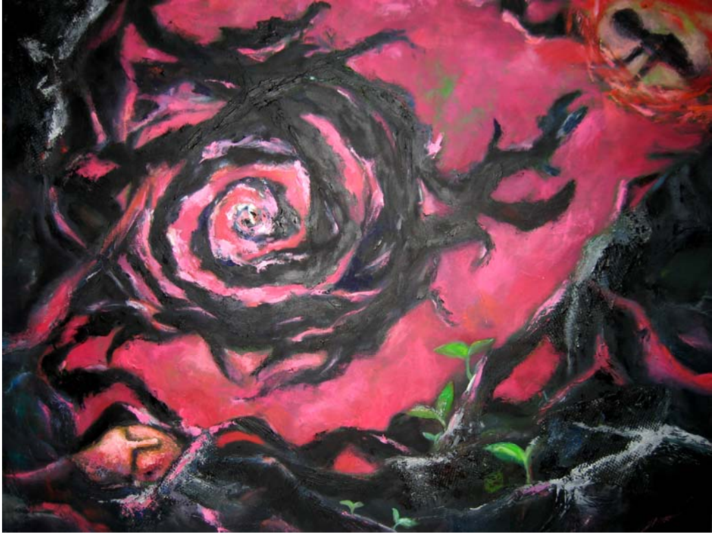
陳惠君 生命的延續 油彩・畫布 91 × 116.5 cm 2007