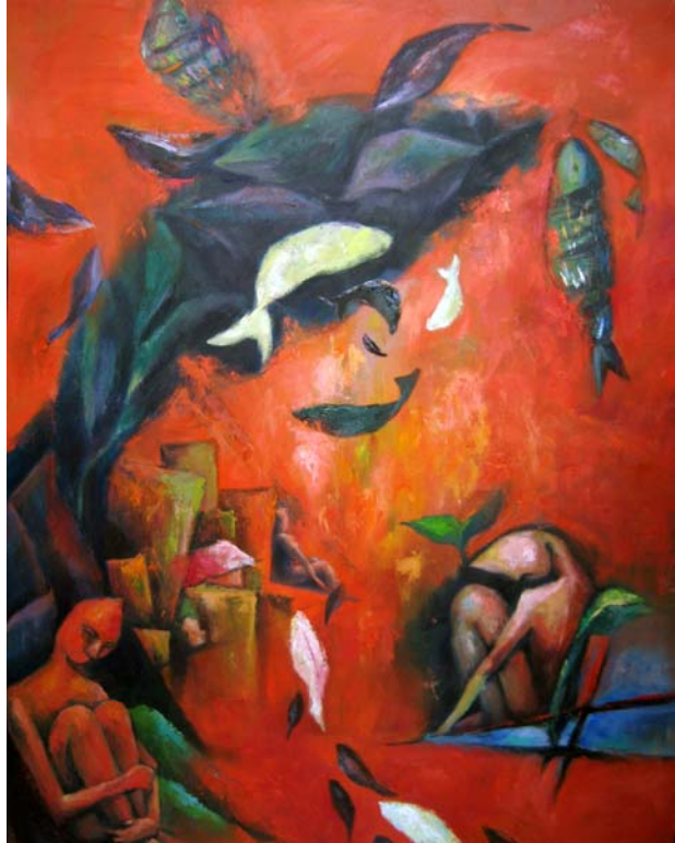
陳惠君 洄游 油彩·畫布 116.5 × 91 cm 2007

在第一節「洄游原鄉」的說明文字提到「追本溯源」，這是中國人相當重視的觀念，其代表意義為：追溯事物的根本源頭。所以，飲水要能思源，不要忘本，就像洄游的魚類，必須回到其出發