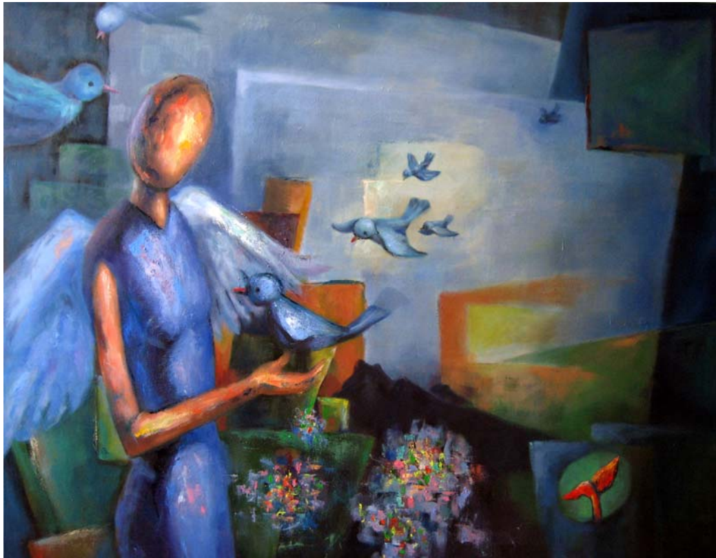
陳惠君 內心的嚮往 油彩・畫布 91 × 116.5 cm 2007