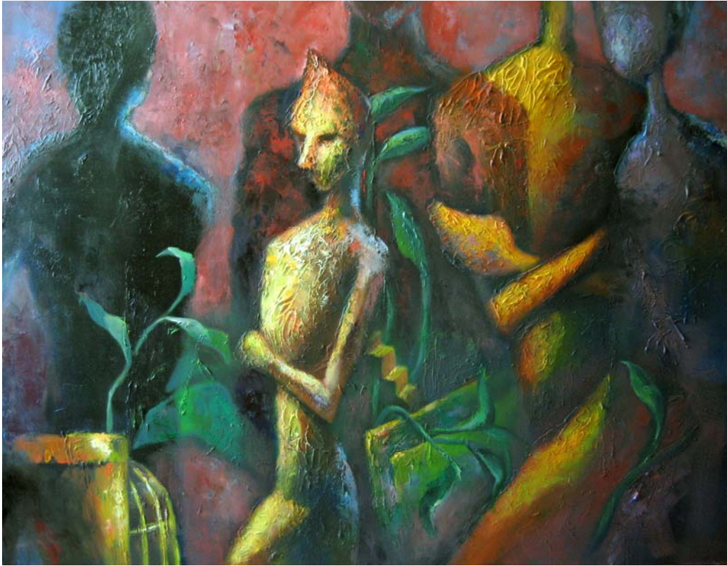
陳惠君 沉思塵世 油彩・畫布 91 × 116.5 cm 2007