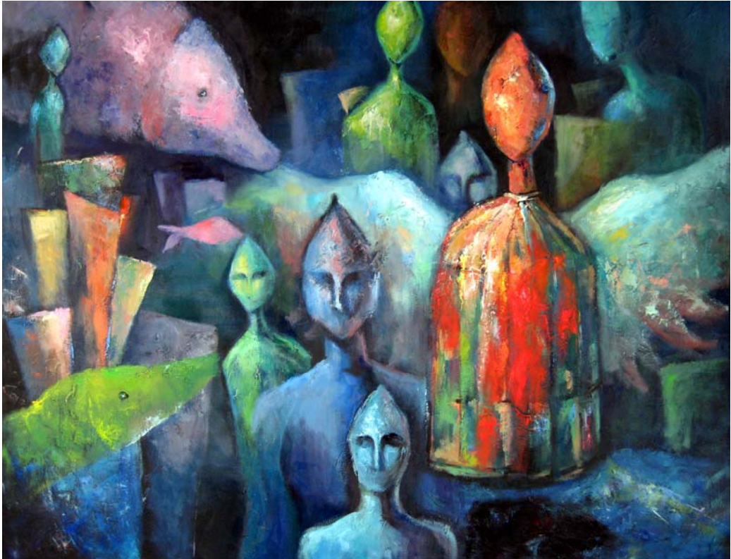
陳惠君 洄遊旅程 油彩・畫布 130 × 162 cm 2007