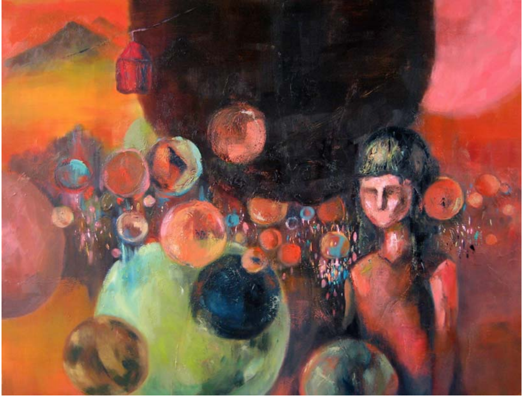
陳惠君 凝視自我 油彩・畫布 91 × 116.5 cm 2007