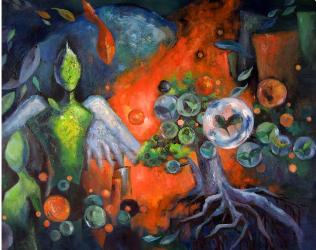
陳惠君 洄游原鄉 油彩・畫布 130 × 162 cm 2007