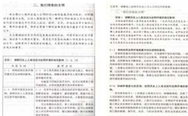
圖 5-3 課程標準（二）（圖左）和課程標準（二）解讀（圖右）的呈現方式（資料來源：中華人民共和國教育部，《全日制義務教育《歷史與社會》課程標準(二)（實驗稿）》，頁 15。教育部基礎教育司組織，《全日制義務教育《歷史與社會》課程標準(二)解讀（實驗稿）》，頁 92。）

課程標準（二）仍舊採用綱目式呈現，需透過課程標準（二）解讀的說明，予以深入化，尤其內容標準的部分，通過《解讀》，呈現課標的原創內涵。