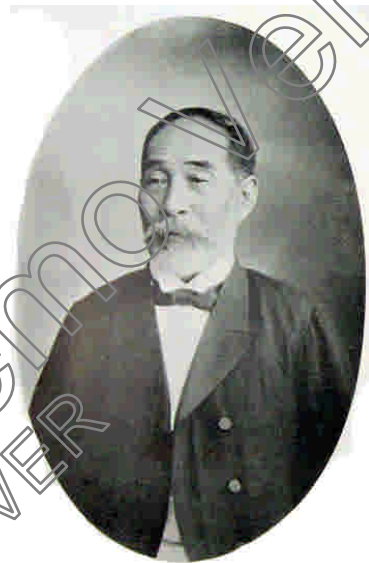
圖 3-2-1 臺北官設消防組首任頭取澤井市造

消防組的統一工作 118 。當時，澤井市造以「俠義」聞名於世，時人將其比擬為「天川屋義兵衛」 119 。其受命後，以個人財產為經費 120 ，「先將目前居住在臺北之消防人員、土木工程人員組成一隊，稱之為『共義組』，計畫在其糾合下，逐漸成立完整的消防組」。草擬消防組之規約和會則，作為約束旗下組員之規範 121 。2月28日向臺北廳提出設置共義組之申請 122 。共義組可說是澤井市造以其資產全力投入經營的消防組織，亦可說是其日後成立「臺北消防組」之前身 123 。