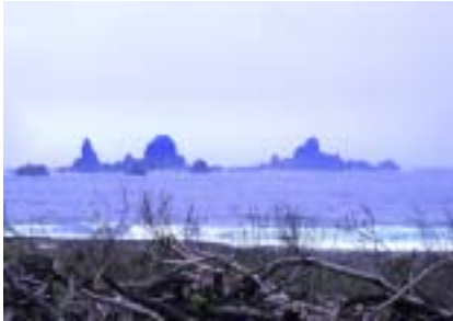
圖 01-03 蘭嶼景觀 1

，將因文明的衝擊而面臨失墜潰滅的危機。以學術的角度而論，原住民文化是台灣重要的文化資產，不論在地理、人種、歷史和藝術各方面，都有其保存的價值。個人於七十二年開始旅遊尋訪蘭嶼，為蘭嶼特殊的人文與景觀深深吸引。蘭嶼是一座風光綺麗（如圖 01-03，圖 01-04），佈滿了熱帶植物的小島，俗稱「蘭花之島」的島嶼，乃屬熱帶系統而與台灣本島高山原住民族文化迥趣。