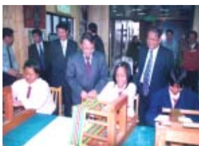
圖 01-02 原住民文化教育活動 2

個人在台東馬蘭部落出生成長，自幼與原住民生活接觸，至負笈台北完成高等教育後返鄉投入原住民重點學校從事美術教學十餘年，近年來又承辦教育部原住民藝能班計畫，推展原住民文化藝術教育（圖 01-01，圖 01-02）；從學校及社區角度觀察到強勢主流文化衝擊下的原住民族，在社會、文化、經濟方面等等不利的現象，或因為不善於應用資訊科技、或其民族價值觀使然，族群總體文化在傳統世襲與現代生活之間充滿矛盾與斷裂。身為原住民重點學校教師，希望能以個人所學為原住民文化藝術奉獻心力。