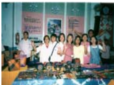
圖 01-01 原住民文化教育活動 1

台灣原住民族在物質文化、社會組織與生計活動上的表現，均富多樣性及獨特性。原住民族的藝術風格，豐麗不失質樸，純實兼具巧思，在顯示出人類文化之原創性與變異性，縱與世界其他民族相較絕不多讓(1)。