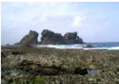
圖 01-04 蘭嶼景觀 2