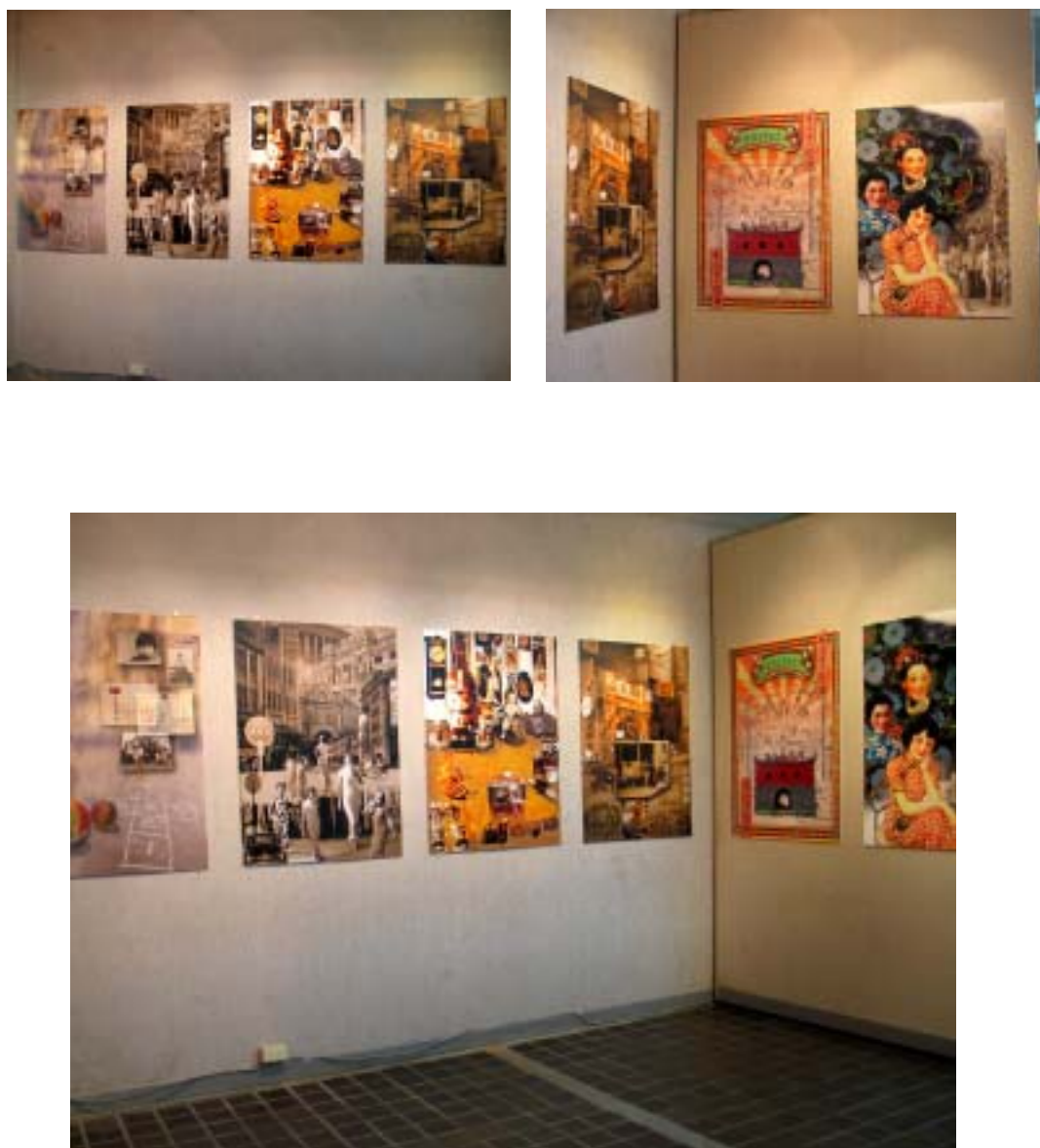
圖 40 展場呈現