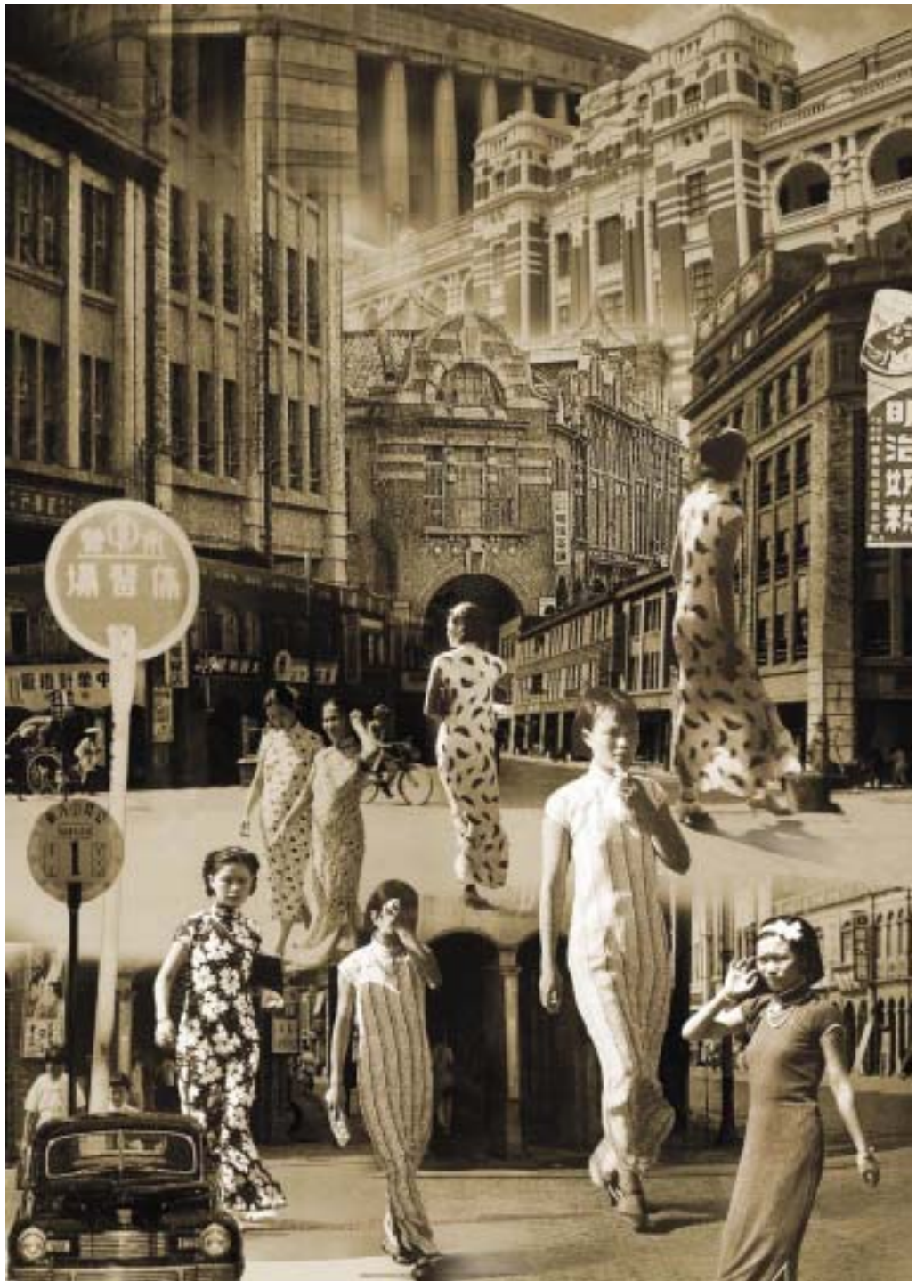
圖 38 作品呈現 - 回到台北 40 年代