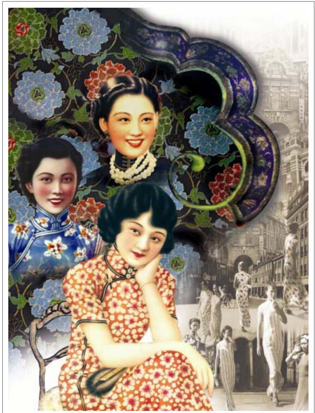
圖 34 作品呈現 - 上海美女圖