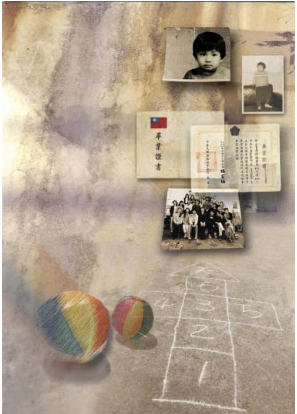
圖 39 作品呈現 - 憶童年