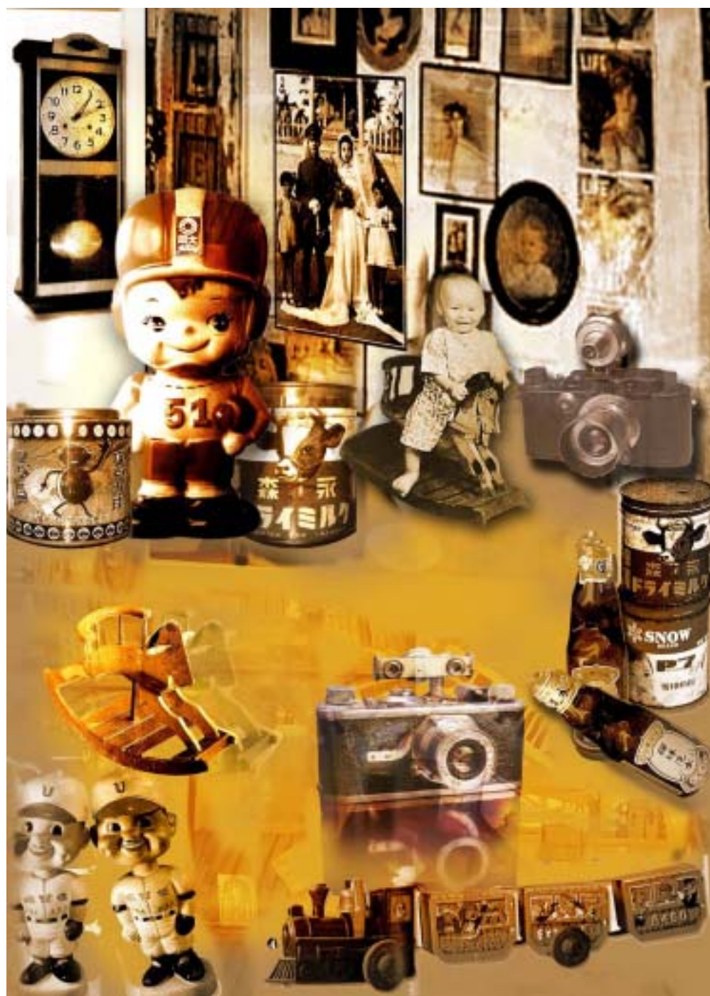
圖 37 作品呈現 - 童趣