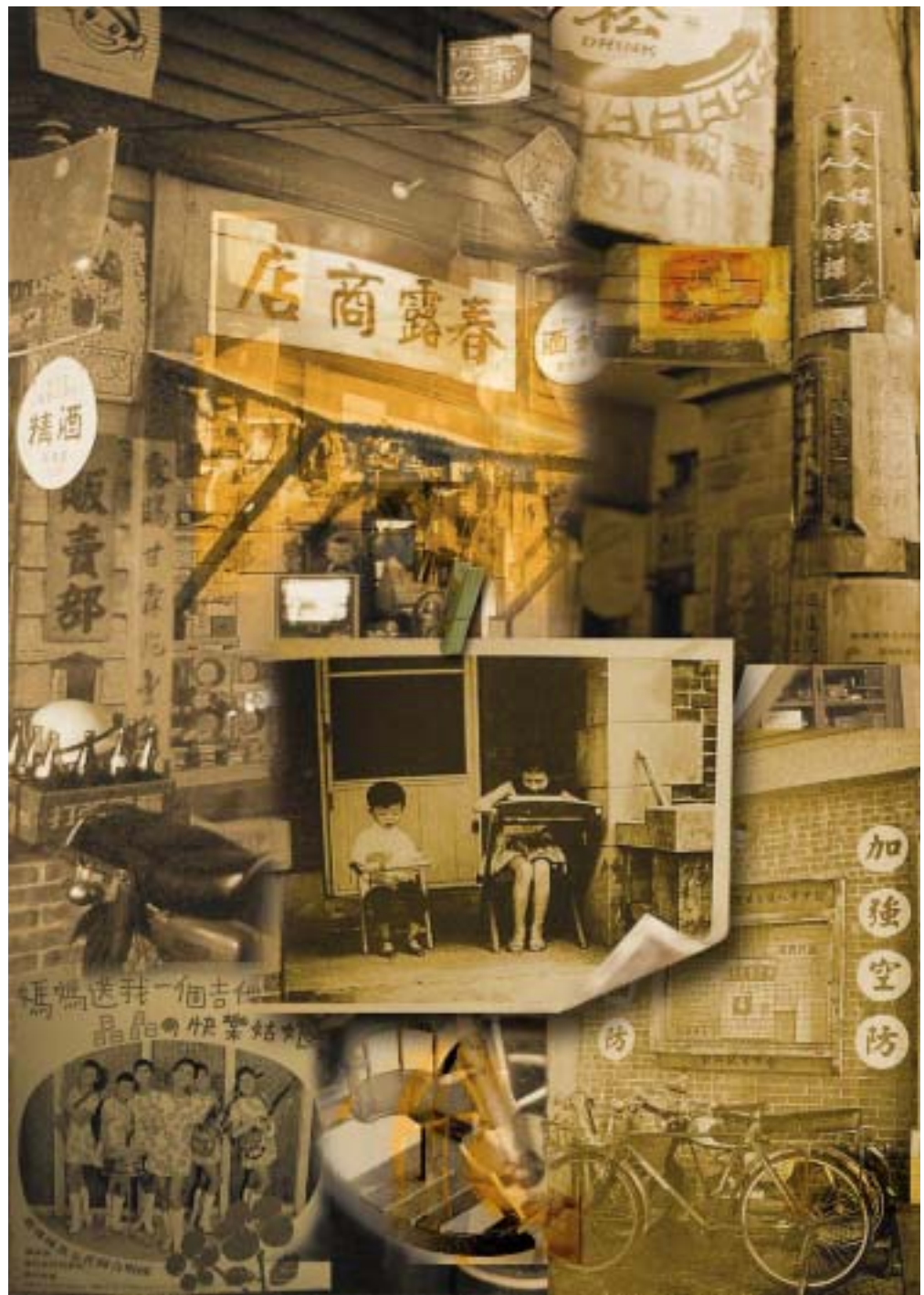
圖 36 作品呈現 - 童年好滋味