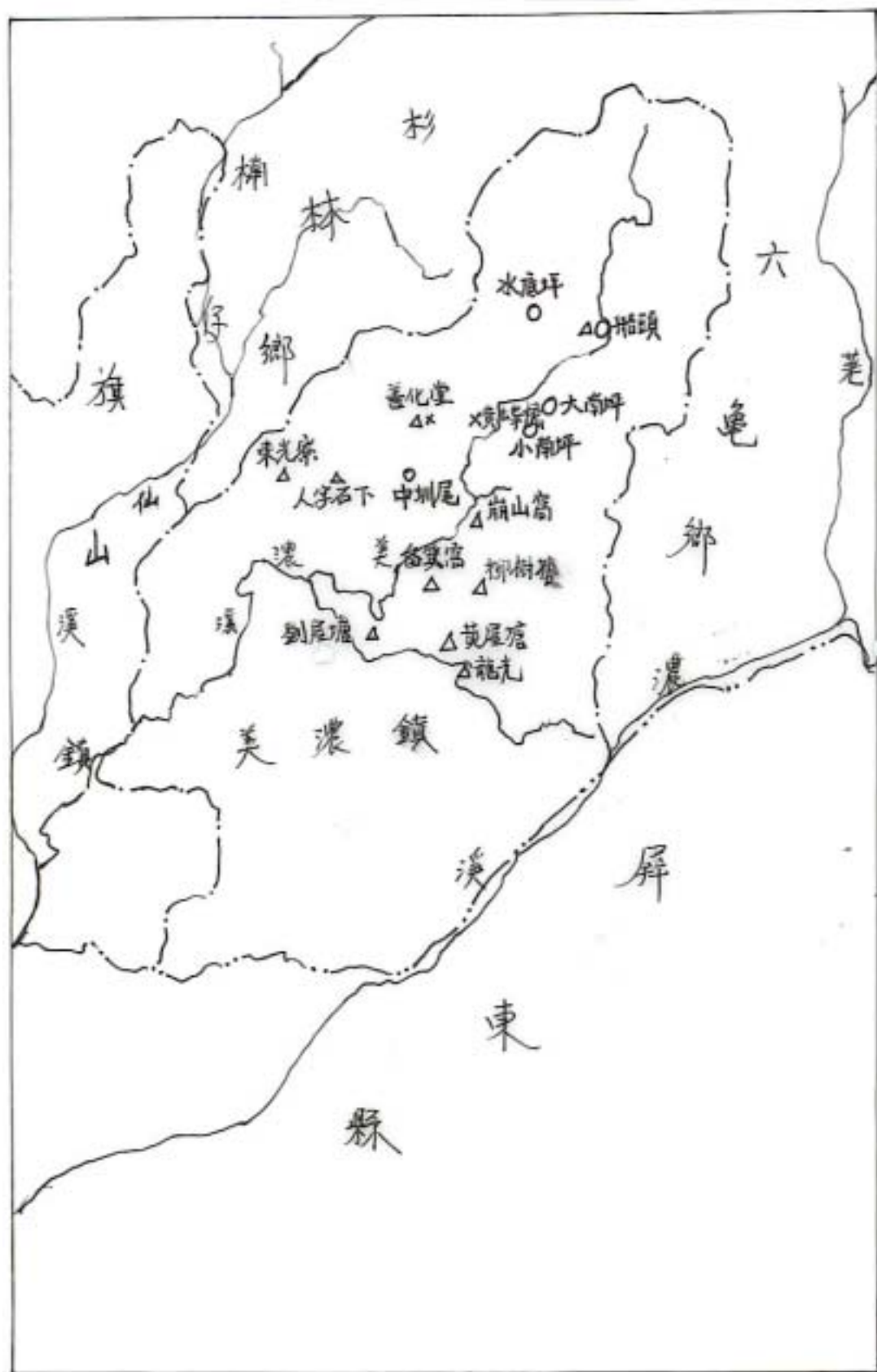
圖 2-1 美濃地區考古遺址分布圖

說明：依據原圖改繪 ○表大湖文化期 ▲表高松文化期 ×表近代文化期