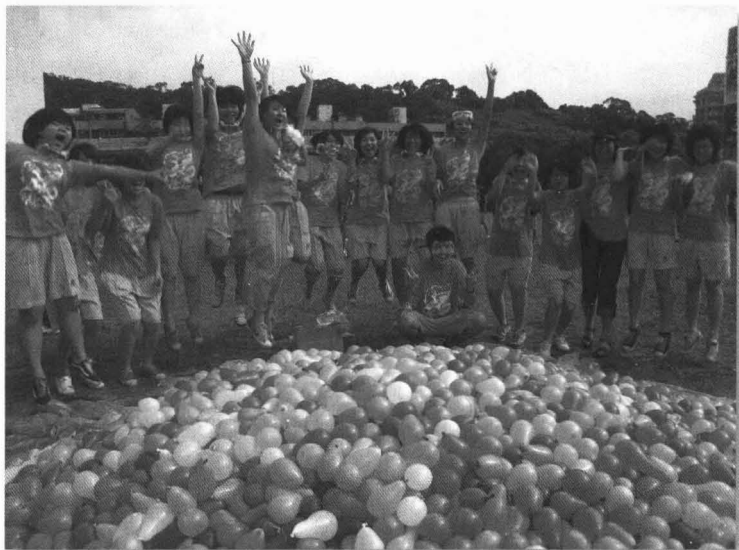
浴水重生，自信昂揚的水球大戰。

升大學的錄取率是相對的標準，是不同角度的觀察。若從每位學生都要考上臺灣大學的標準看，內中升學成績當然不夠好；若從每位學生都要考上大學的標準看，內中升學成績當然好；若從每位學生都要考上公立大學的標準看，內中65%的公立大學升學成績（考試分數，非選填志願結果），當然有再努力進步的空間。