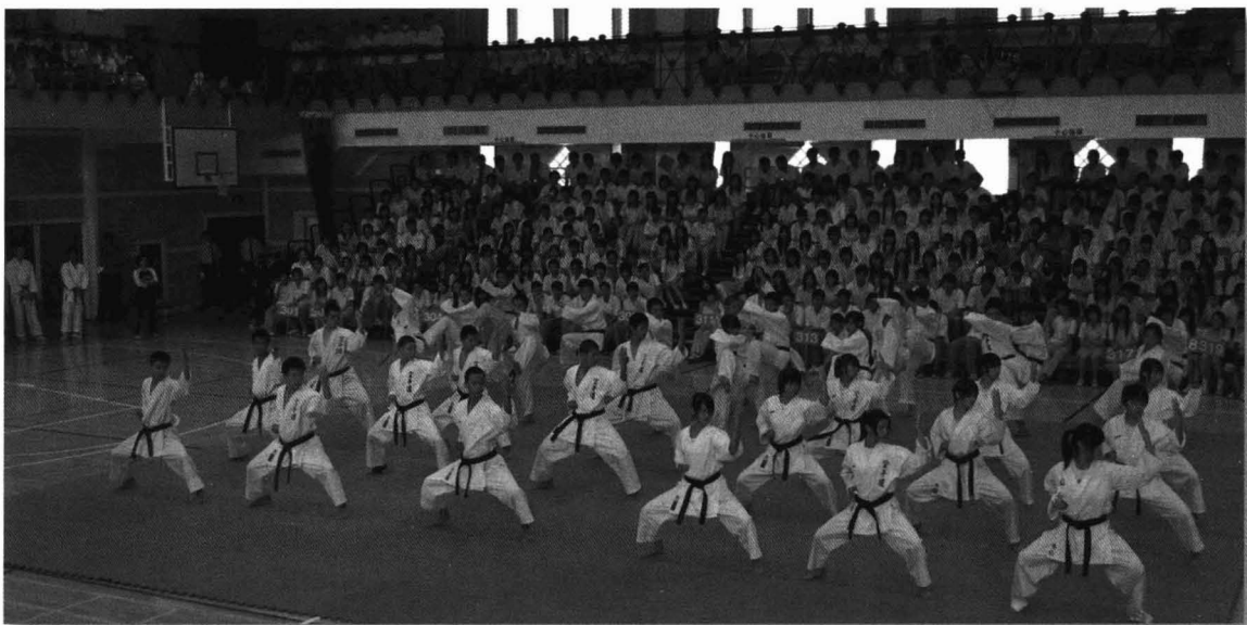
內中高手空手無敵。