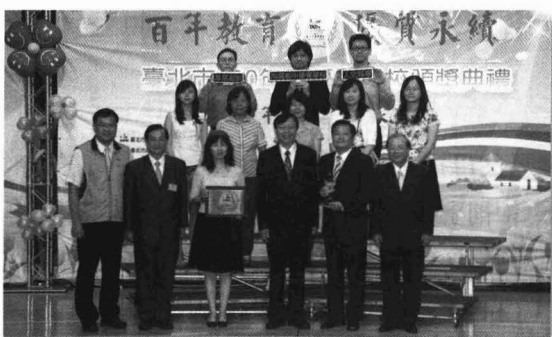
教師教學優質學校。