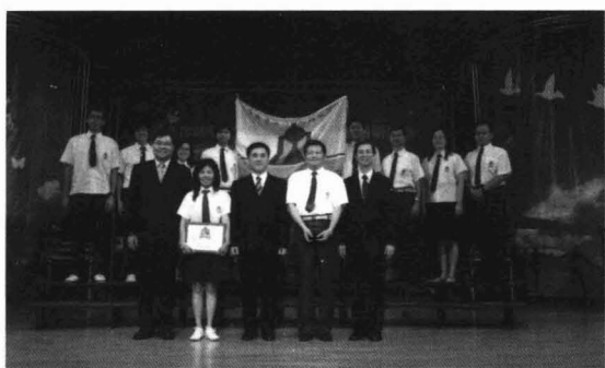
學生學習優質學校。