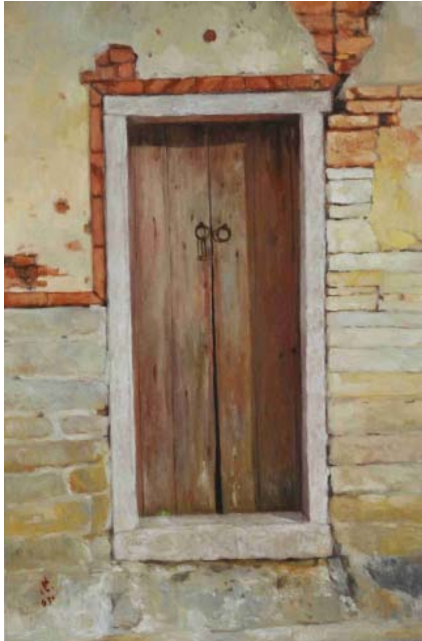
圖九 門(一) 尺寸：91cm × 60.5cm(30M)