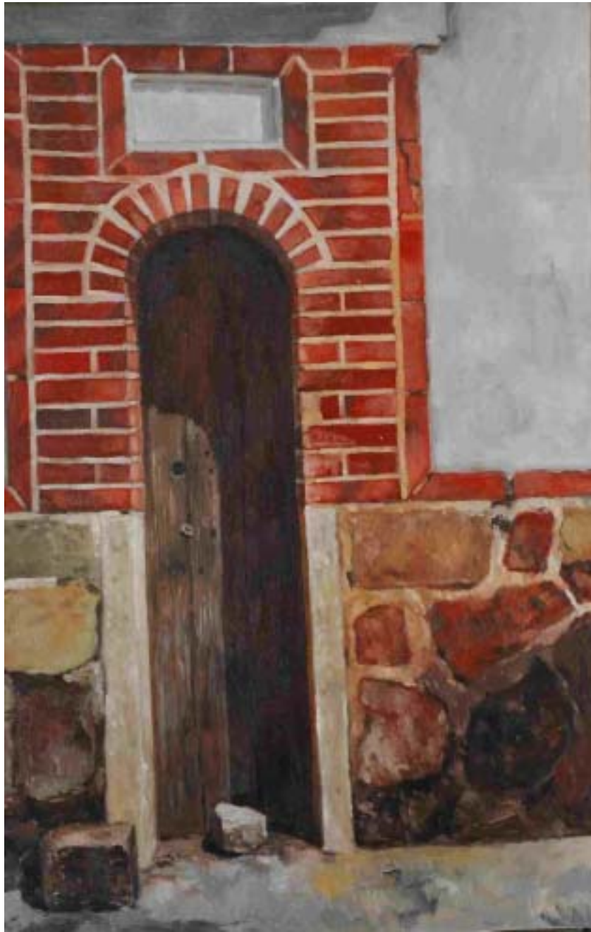
圖十 門(二) 尺寸：91cm x60.5cm(30M)