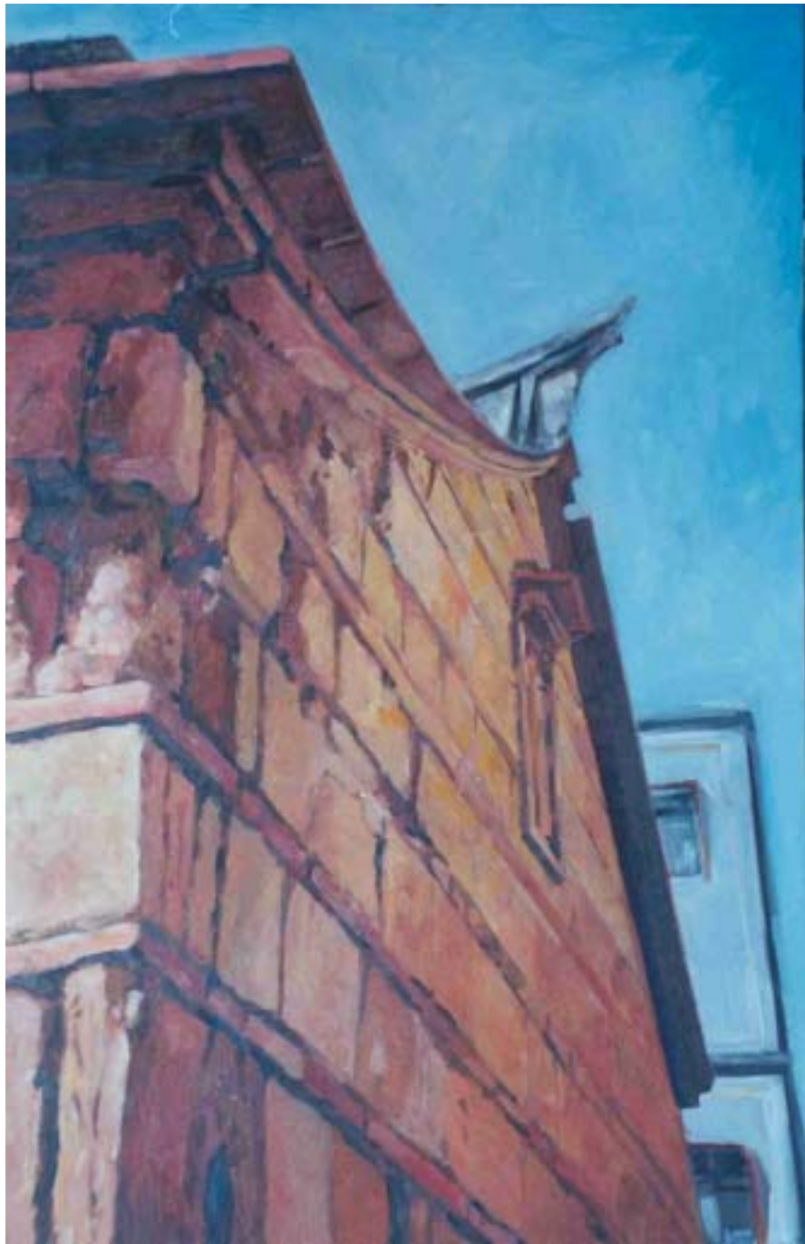
圖六 歲月 尺寸：91cm x 60.5cm (30M)