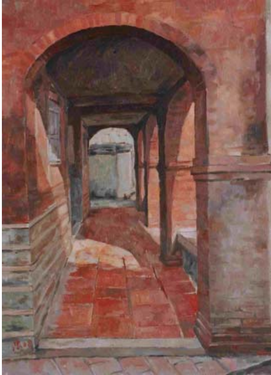
圖十一 五腳氣洋樓 尺寸：91cm x 65cm(30P)