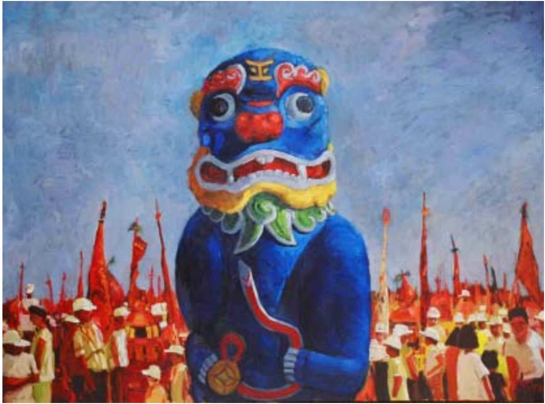
圖十四 信仰 尺寸：130cm × 97cm (60F)