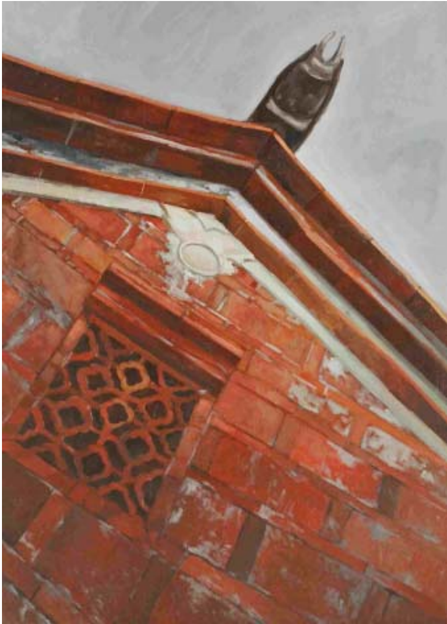
圖七 燕尾之美 尺寸：91cm x 65cm (30P)