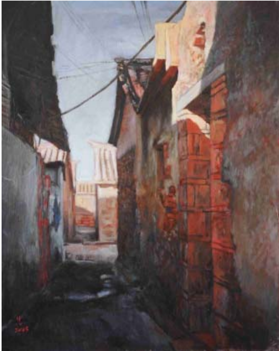
圖四 舊巷 尺寸：91cm x 72.5cm (30F)