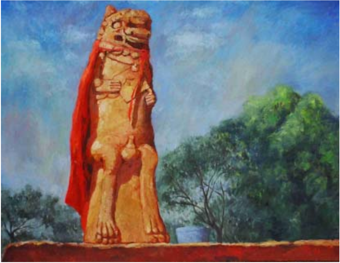
圖十三 守護神 尺寸：116.5cm x 91cm (50F)