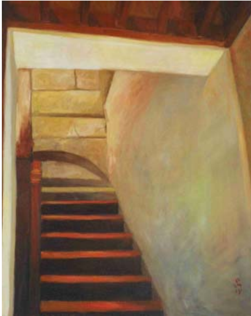
圖十二 梯 尺寸：91cm x 72.5cm (30F)