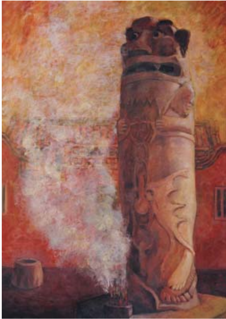
圖一 黃昏的故鄉 尺寸：145.5cm x 112cm (80F)