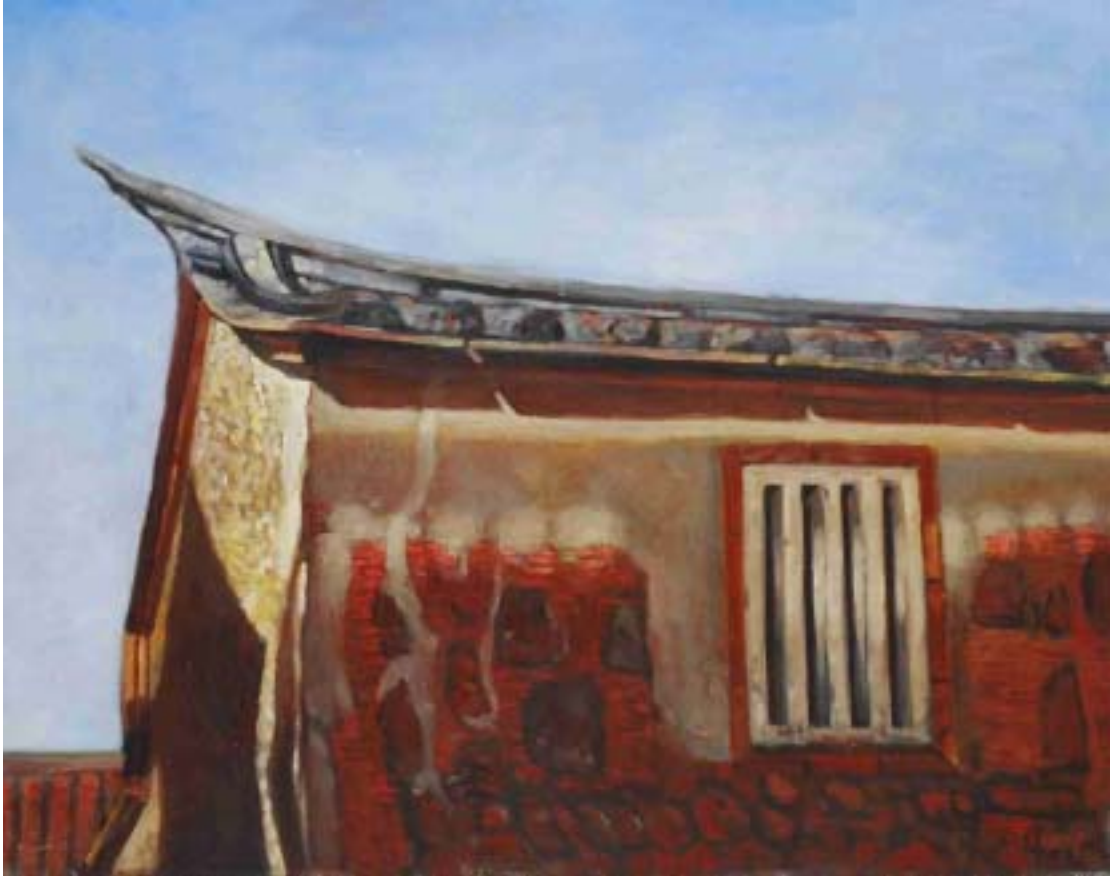
圖五 暖陽 尺寸：91cm x 72.5cm (30F)