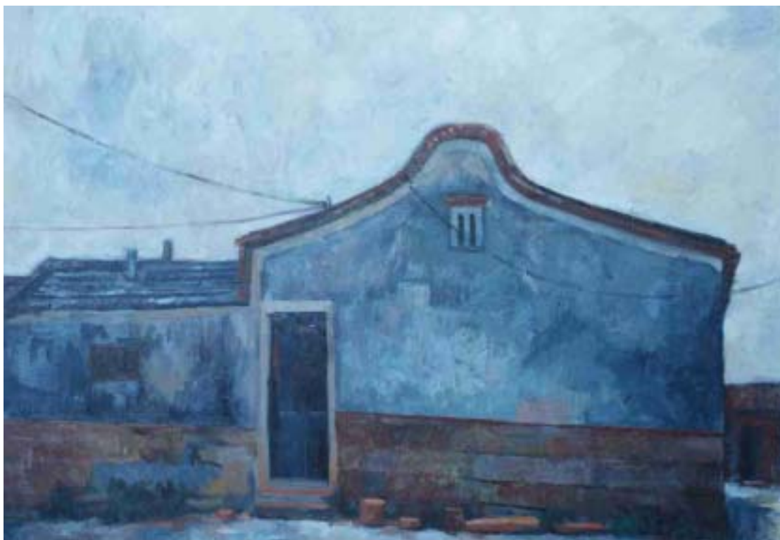
圖二 「一落兩櫺頭」厝 尺寸：91cm x 65cm (30P)