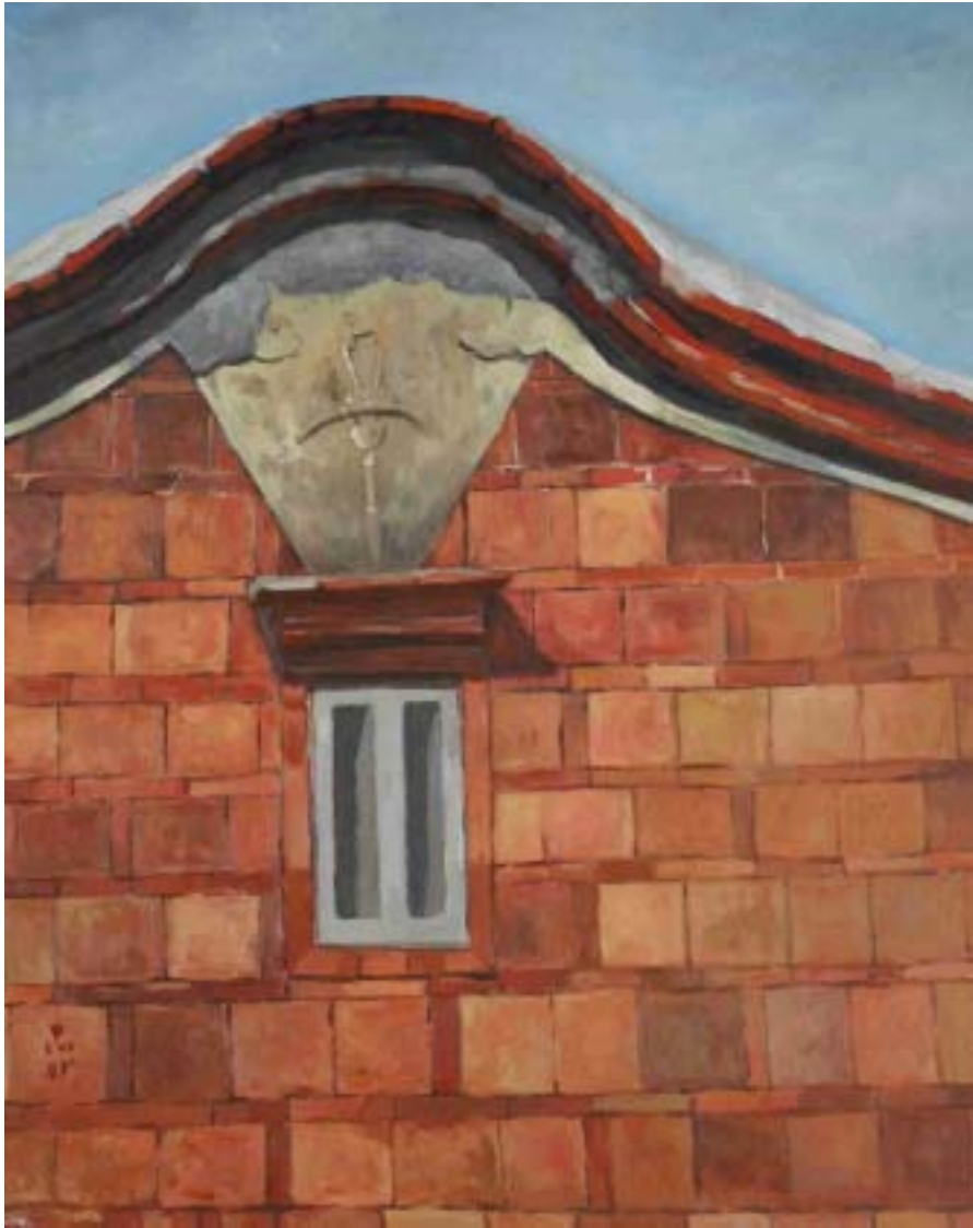
圖八 馬背之美 尺寸：91cm x 27.5cm (30F)