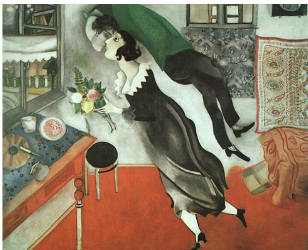
夏卡爾 生日 1915年 油畫紙板 80.6×99.7cm 紐約現代美術館藏

在夏卡爾的作品當中，最能感受到愉悅氣氛的，就屬一系列描繪跟戀人有關的作品。例如「生日」這幅畫，這是夏卡爾在西元1915年