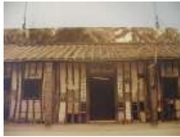
圖 3-2-5 穿鑿屋 41