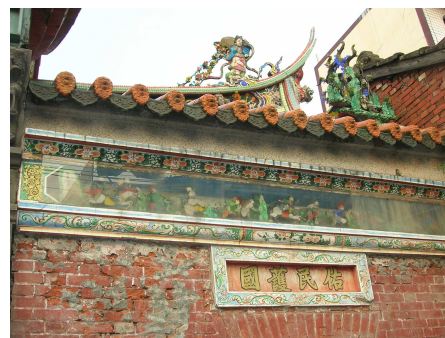
圖 6-20 埕頭上的剪黏