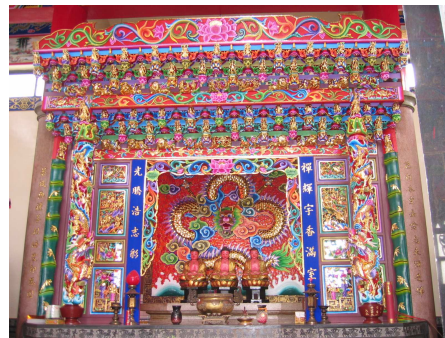
圖 6-18 釋迦牟尼神龕