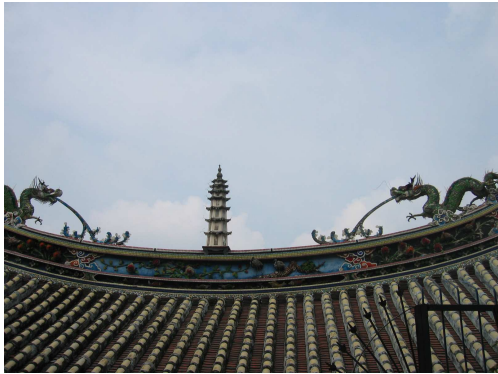
圖 6-21 正殿屋頂的「雙龍拜塔」