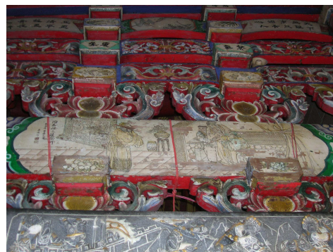
圖 6-23 陶恭祖三讓徐州