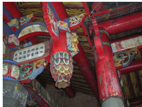
圖 6-16 彩繪吊筒