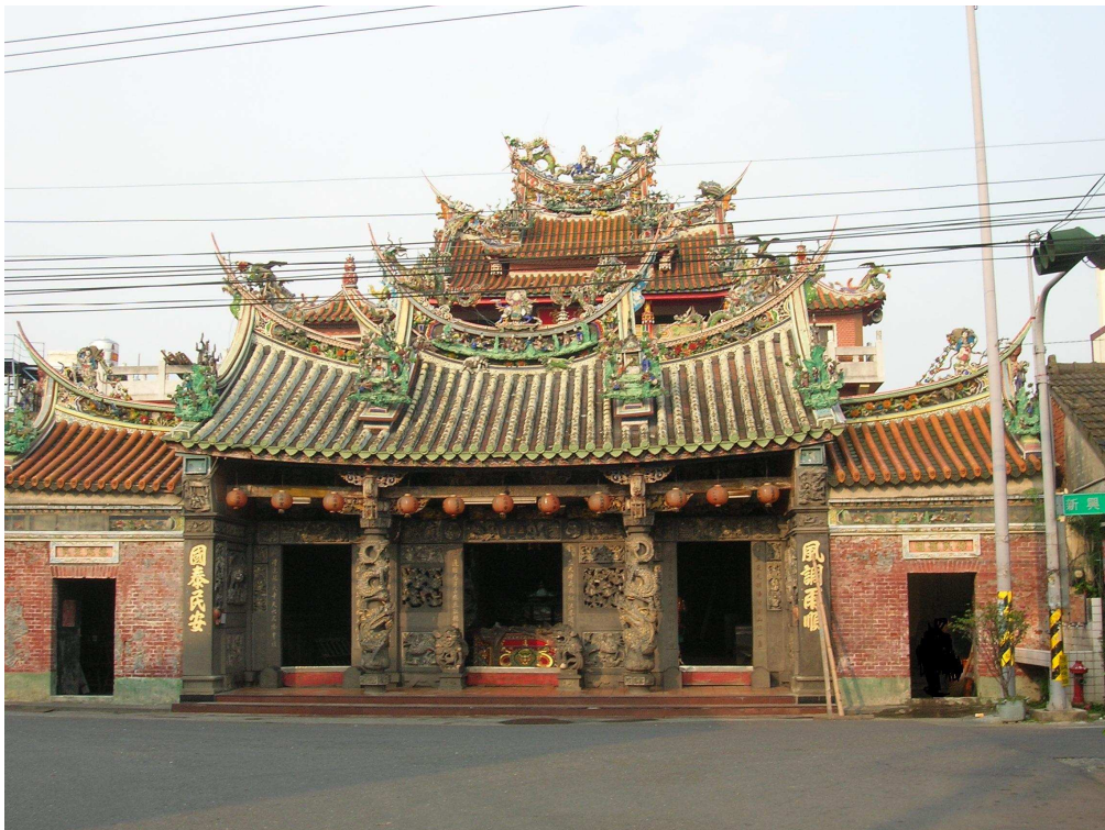
圖 6-2 五通宮全貌