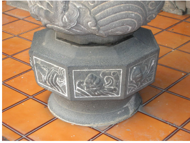
圖 6-11 龍柱下的八角柱珠