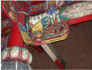
圖 6-13 前殿的老鷹托木

木雕大量應用在神龕、斗拱、棟架、員光等支架上，題材豐富，用色華麗，兼具實用與藝術之美。放置神像的神龕，更是雕梁畫棟，精緻非常。