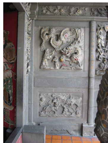
圖 6-10 步口廊左側的對看堵