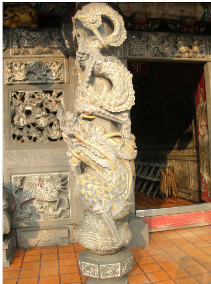
圖 6-7 大門前的龍柱

殿內的牆壁裝飾許多石雕作品，上面均刻有出錢奉獻的善信大名，筆者將其內容作了簡單的分類，主要有四大類型，一為歷史人物故事（含戰爭、勵志、稗官野史等），二為神仙軼事，三為傳奇小說人物故事，四為傳統花鳥樹木，每片浮雕並將其主題名稱刻上，方便欣賞的人辨識（詳細內容請參閱本節下文）。