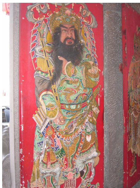
圖 6-25 門神（二）