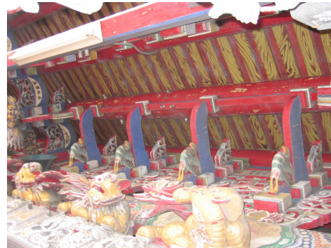
圖 6-6 壽樑上看架斗拱，支撐與裝飾