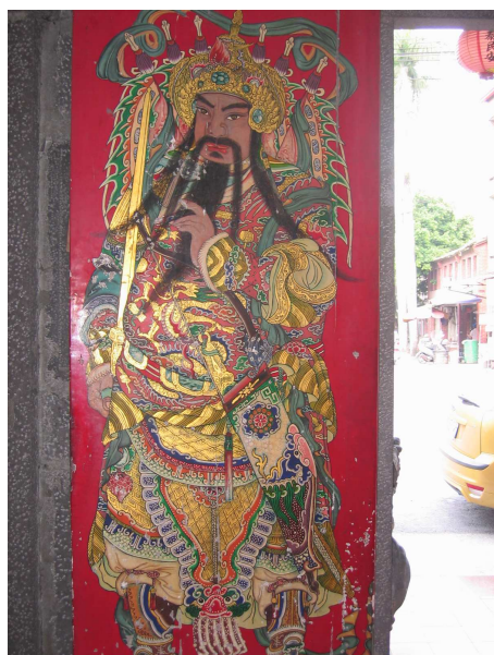
圖 6-24 門神（一）