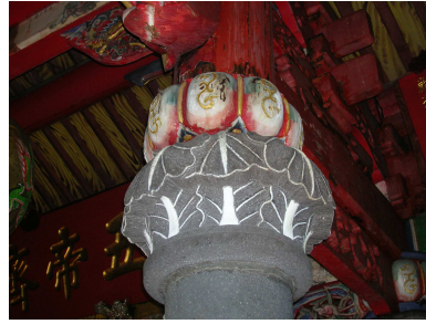
圖 6-12 內殿的柱頂設計