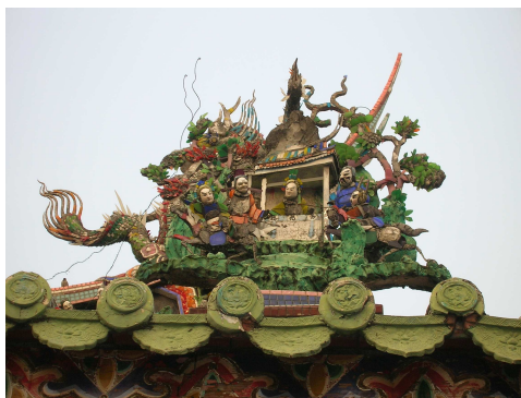
圖 6-19 屋簷上的剪黏

五通宮的剪黏也具有很高的藝術成就，主要應用在水車埕及屋簷的裝飾，如前殿屋脊上的「雙龍搶珠」，正殿上的「雙龍拜塔」等。龍能注雨以濟蒼生，可祈雨辟邪壓火災，或謂龍好吞火，將之置於屋脊上可防止火災發生。屋脊兩側及燕尾脊端，多為傳說中的神仙人物，有八仙、仙女仙童等。在脊下長條形的埕頭，也都為剪黏作品，主要為歷史人物與節義故事。(見圖 6-19~6-21)