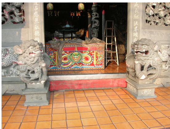
圖 6-9 正門兩側的石獅