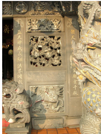
圖 6-8 前殿中門左側的石堵