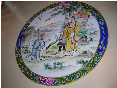
圖 6-22 悉達太子遊城門

門神也是國畫中的特殊展現，五通宮的六尊門神堪稱宮內最具神韻的繪畫作品，威而不慍、嚴而不令人懼，栩栩如生。(見圖 6-24~6-25)