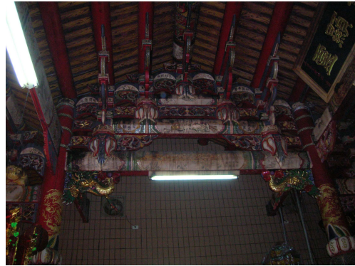
圖 6-4 正殿大柱與棟架（三通五瓜）