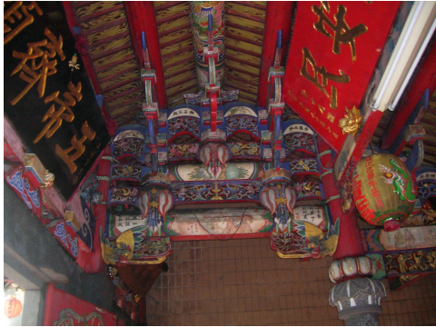
圖 6-3 前殿大柱與棟架（三通三瓜式）