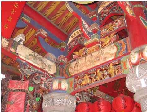
圖 6-5 複雜的棟架