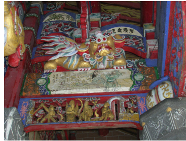
圖 6-14 獅座與員光的木雕