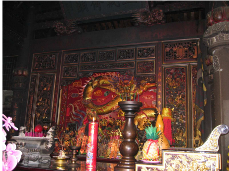
圖 6-17 五顯大帝神龕