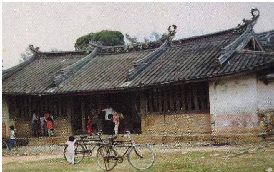
圖 3-3 福建詔安縣官陂鄉的五通宮

這個典故顯然是取自典籍，但根據本地耆老所述，五通宮宮號是沿用福建詔安縣官陂鄉的香火發源地「五通宮」而來。