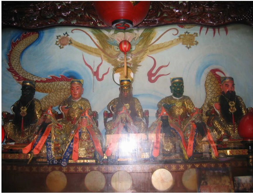
圖 3-1 彰化縣白龍庵五靈公（五福大帝）神像