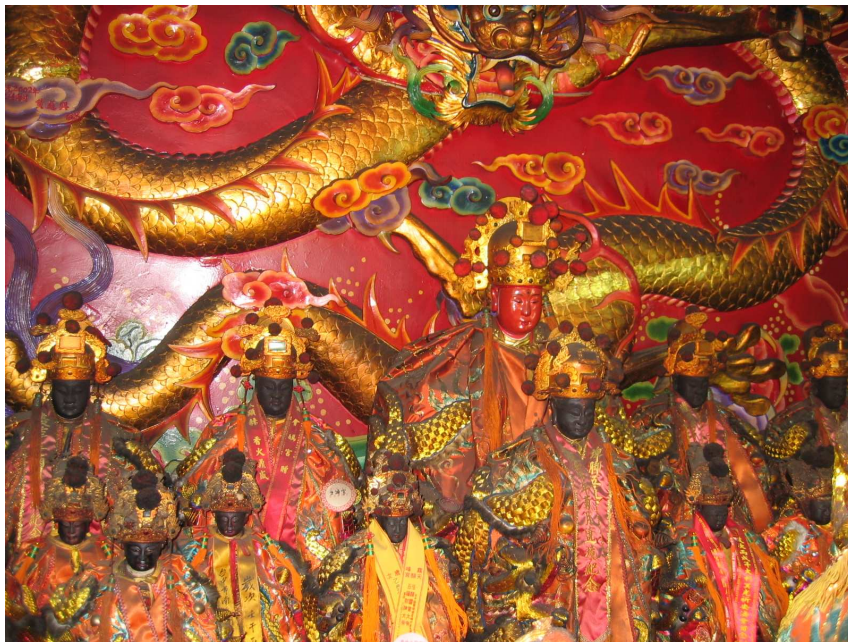
圖 3-2 彰化縣五通宮五顯大帝神像