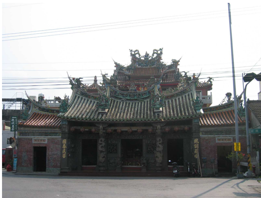
圖 3-5 五通宮前殿