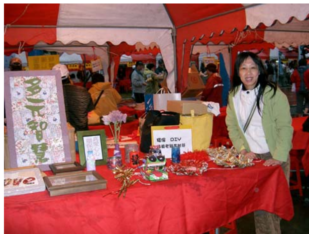
社區環保 DIY 創意教學 2005/2/19

就如 Lubart 指出創造力歷程是完成具獨特性、適應性的創作時所需要的一連串思考和行動（蔣國英譯，2007）。更因為我也符合具有好奇心的需求，自我決定和接受挑戰的勇氣，也具有強烈的動機和獨立自主的情懷，是屬於自我實現的創造力（毛連塏等，2000）。所以，我就是我，我喜歡創造力，我是有創造力的人。