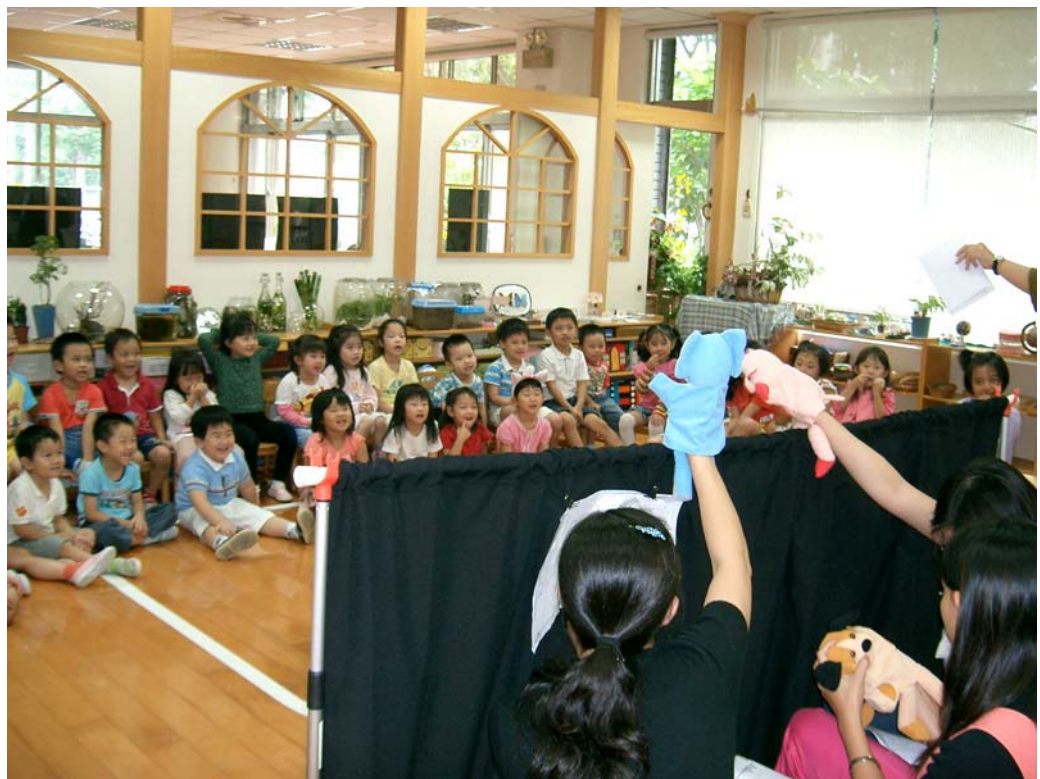
使用曬衣架臨時布幕的教師劇團