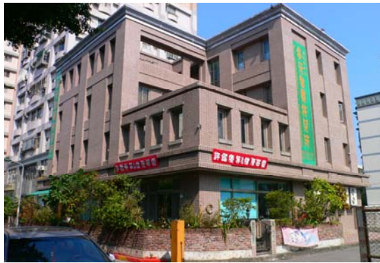
我的托兒所外觀全貌

待萌芽、等待陽光、等待雨水而茁長。這麼多年，我知道創意的教學有效，更知道創意的教學有用，但孩子還小並不能立竿見影。因此，教育是十年樹木，百年樹人，真是一點都不錯。