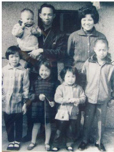
我的原生家庭 1966 年

以快樂做自己，專心照顧事業和求學，原來我是這樣來的，我是非常幸運與幸福的人，是這樣的環境塑造了我和供養著我，讓我成為有創造力的人。