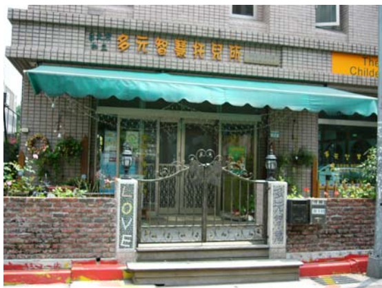
大門口自己貼的招牌