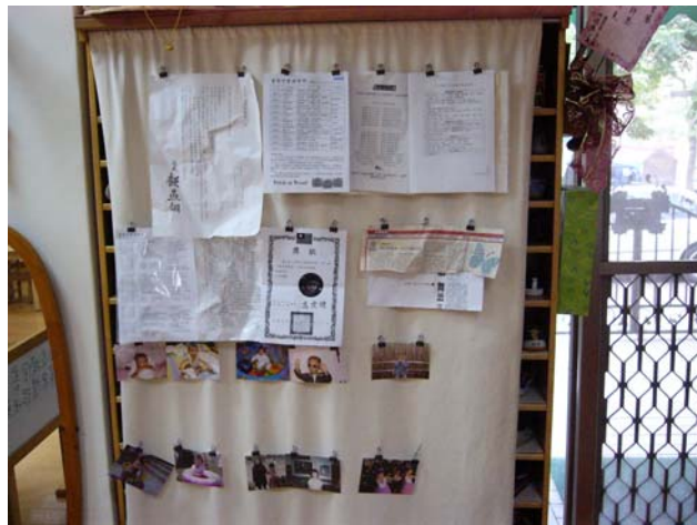
帆布當成鞋櫃的簾子， 縫長尾夾當公告欄