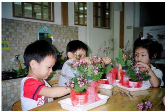
2005 年父親節布丁杯環保創意花藝

每個月安排一次插花課，除了認識植物與欣賞花卉的美與環境佈置的關係，最主要在母親節與父親節，表達對父母親的孝思，學習人文教育。也在聖誕節和過年時，用花藝裝飾節慶的氣氛。