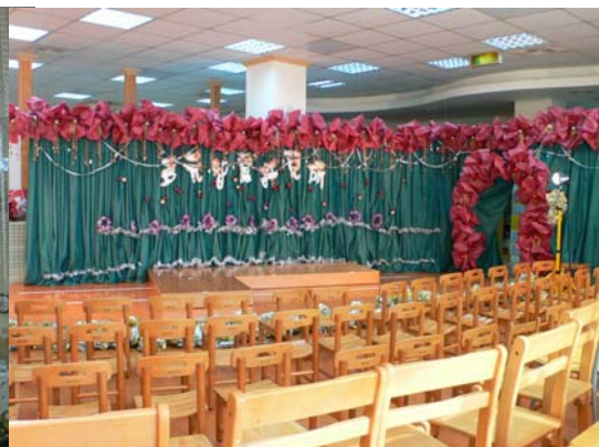
2008 年聖誕節一網棉紙變紅花

有位媽媽在她的網誌寫下：「整場表演很像是幼稚園才藝課的期末驗收，它並不是小朋友專門為聖誕活動而特別練的舞蹈或音樂，而是平常就一點一點慢慢教出來的。所以它的表演，並不需要有老師在前面帶著大家作動作。負責的老師，只是在旁邊敲著很像鈴鼓的東西，一個鼓點一個鼓點指揮大家，其他的全交給小朋友自己。」(6 回應 091223-LSC)