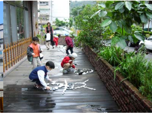
孩子們在院子玩石頭