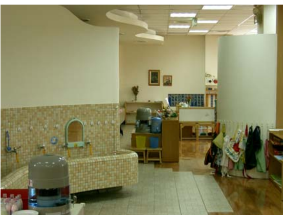
洗手台與開放空間