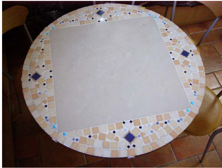
利用做洗手台剩餘的磁磚，親手貼成桌子