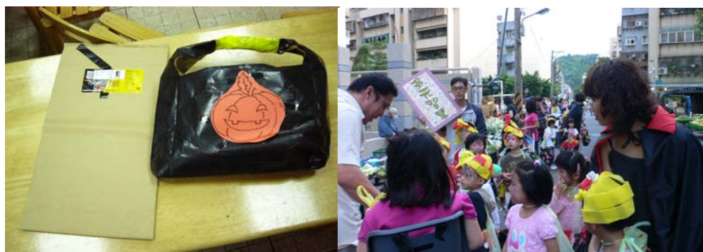
照相館紙袋變成萬聖節提袋

所以托兒所的老師每次問我說，你這個要丟掉嗎？東西留太多了吧，我說對我們學校沒有什麼東西叫太多，只是你要不要用而已，我收集紙袋，一個萬聖節，如果 50 個孩子就有用掉 50 個袋子。我用照相館的袋子，剪兩刀再折成一個要糖果的提袋，10 年前創到現在還是最流行的包款。（見照片）