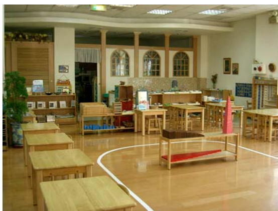
我設計的蒙特梭利教室