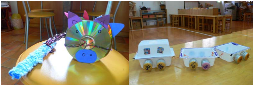
2007 年三隻小豬 CD 花燈

而這位媽媽 2007 年在部落格回應留下：「哈！今年到中正紀念堂燈會時，我們帶著學校做的小豬花燈，可滿意的哩！因為注意到的人，都稱讚它的創意！」(回應 070329-CLY)