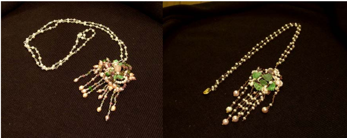
利用珍珠與舊首飾組合的創意珠寶