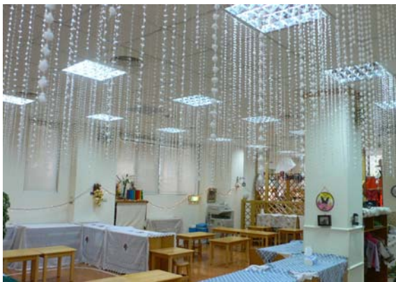
2007 年聖誕節天空下雪了

托兒所的一位老師說：「運用不同素材組合變化出各種美術作品，在教室佈置上運用現有材料創作出不同的佈置型態。例如：聖誕節佈置時，有一年運用白線懸吊成一片白雪世界、有一年用皺紋紙折成紅花，運用在整個聖誕節佈置上。」(22 問卷 090913-HSG)