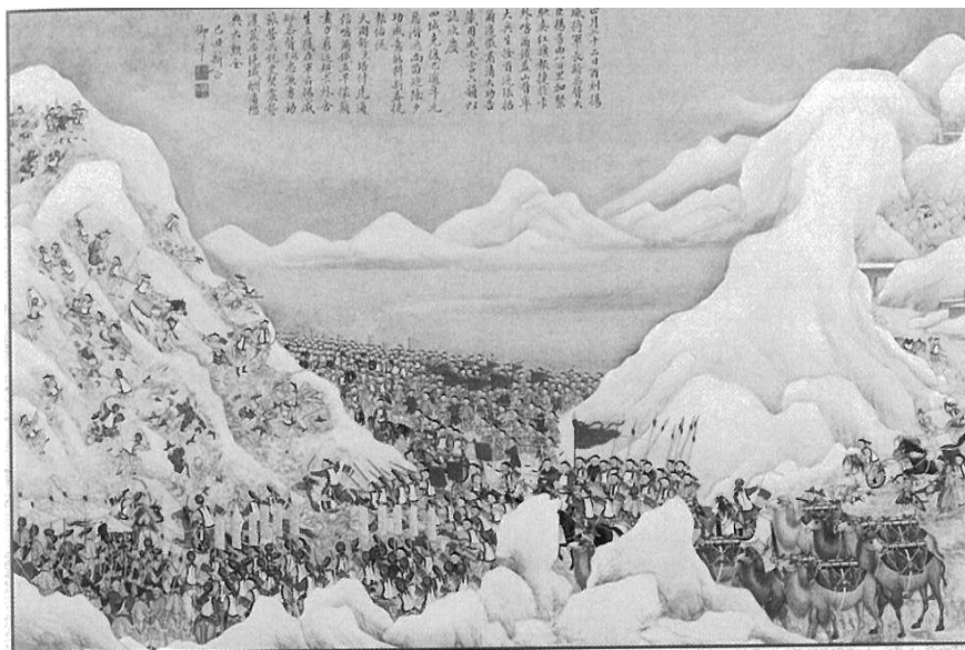
圖一 平定回疆戰圖冊·生擒張格爾

十二月，長齡等密遣回人，出卡縱放間言，指稱「官兵全撤，喀什空虛，諸回翹首以望和卓……張格爾果復率步騎五百，欲乘官兵除歲不備，入卡煽眾，潛襲喀城。」 72 長齡早已經率六千兵，嚴陣以待，張格爾發覺而逃，被楊芳等追至喀爾鐵蓋山。張格爾僅餘三十人，棄騎登山，副將胡超、都司段永福等擒之。