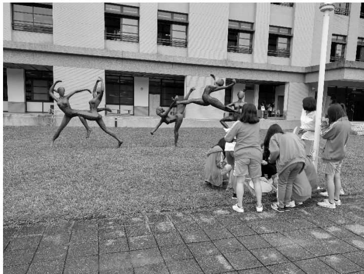
圖3 學生正在進行校園公共藝術探查活動

而在筆者設計並進行古蹟美感課程的同時，校園建築周遭的各種公共藝術以及其背後的藝術文化意義，也逐漸被納入課程思考中，並轉化設計為高一的校園公共藝術課程，例如：逸仙樓旁的校園公共藝術《楓林軒》為紀念本校三高女時代的學姊、日治時期臺灣前輩藝術家中唯一的女性、也是臺灣第一位女畫家和第一位女美術老師陳進女士而設。此外從建國高架橋可清楚看見的「中山女高」四個書法浮雕大字，則為民國 99 年由臺灣最著名書法家董陽孜女士所題字。而校門口的學校全名書法浮雕，是民國 56 年由孫中山長子孫科題字。走入校門後立刻印入眼簾的孫中山銅像，是民國 62 年由雕塑家劉獅，參考蒲添生所雕塑的臺灣第一尊孫中山銅像所製，且根據資料，本校銅像是臺灣唯一依據國父真實身高所做的銅像。而高一公共藝術課程主要是以校園藝術探查為主要學習活動，讓學生從尋找校園藝術品及其背景脈絡的過程中，對於學校藝術文化有更深入的理解（如圖 3）。