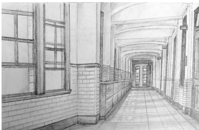
圖 2 學生完成的逸仙樓古蹟素描作品