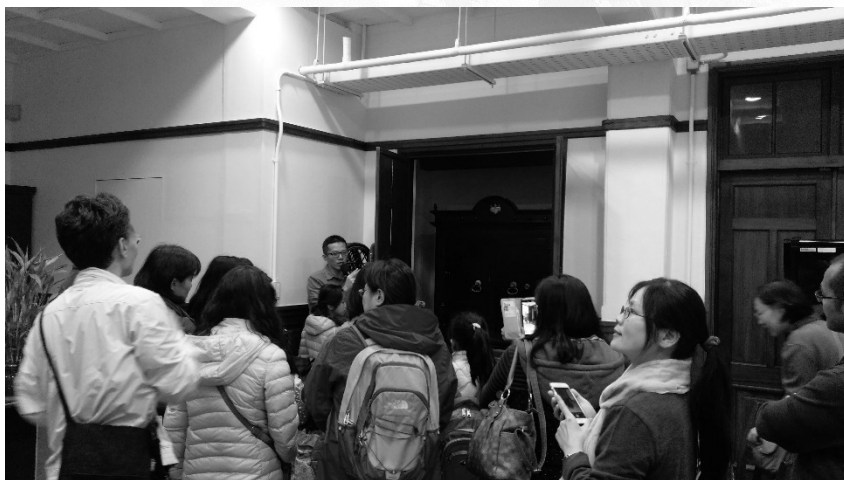
圖6 校友攜家帶眷主動回校請筆者導覽逸仙樓