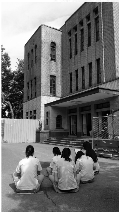
圖 1 藉由素描觀察，讓學生仔細體會古蹟的細節和美感

「逸仙樓古蹟與美感課程」的教學對象是本校全體高二學生，也就是說校園古蹟課程是個擴及全校的學習計畫，而非僅集中於少數學生的特殊活動。課程先透過事前準備的學習素材，以問題引導的方式建構學生對於學校逸仙樓古蹟的基本概念，而後實際參訪逸仙樓，以現場導覽的方式仔細觀察和認識逸仙樓的點點滴滴，例如：外牆圓角的造型收邊、校長室裡的奉安櫃、隱藏在天花板樑柱下的棟札、華麗的迎賓樓梯、具有特殊歷史意義的茶道教室、圓弧形音樂練習室、乃至樓頂所留下的二戰美軍彈孔……等有別於其他學校古蹟的各種特色（黃天浩建築師事務所，2011），帶領學生親眼觀察，鼓勵學生藉由觸摸建築體以及牆上的彈痕，感受歷史的刻痕以及戰爭的餘溫。導覽結束後，則結合素描透視教學，讓學生運用素描技巧，至逸仙樓現場描繪一處自己印象最深或覺得最有美感的建築角落（如圖 1、圖 2），但不強調以專業的素描技巧描繪出作品，結合素描的教學方式，目的在於讓學生有機會能「細細觀察與品味」古蹟之美，讓學生靜靜地坐下來，欣賞這棟每天經過卻不曾認真欣賞的建築，去發現平時從未看見的美，素描技巧不是最終目標。