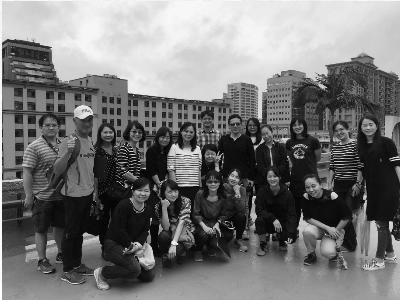
圖5 筆者帶領校內同仁一同進行認識學校古蹟活動