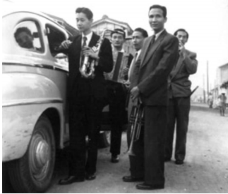
圖 2-1、「后里輕音樂樂團」前往祝賀其好友娶親。