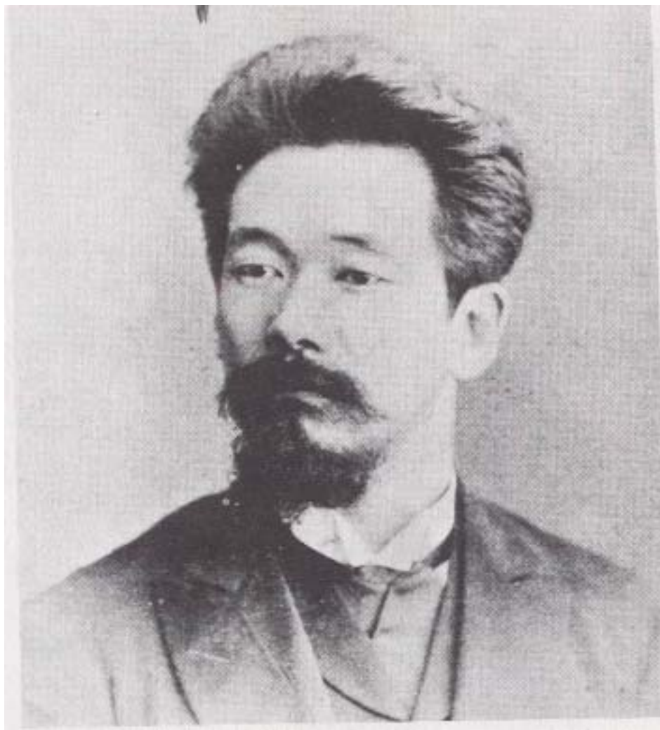
(圖2-1) 西元1878年18歲時的嘉納治五郎先生