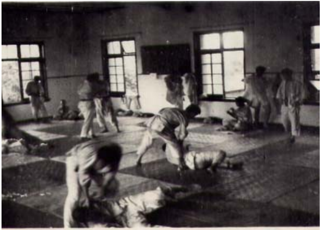
(圖2-20) 民國48年高雄柔道館內練習情形