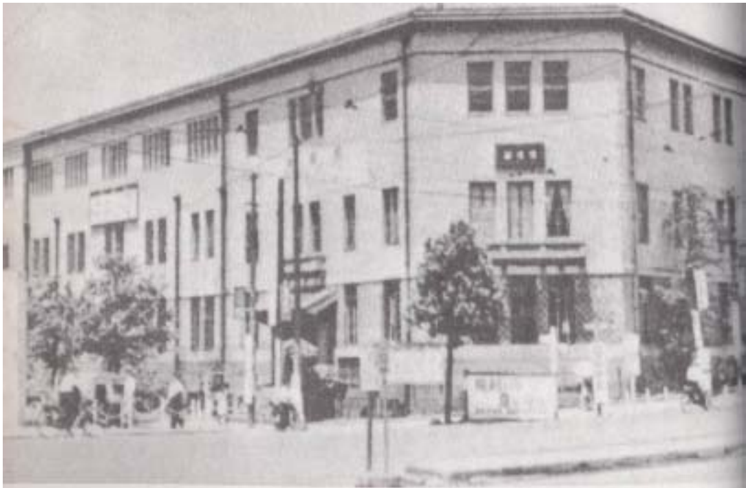
(圖2-5) 西元1948年(日本昭和23年)時水道橋講道館