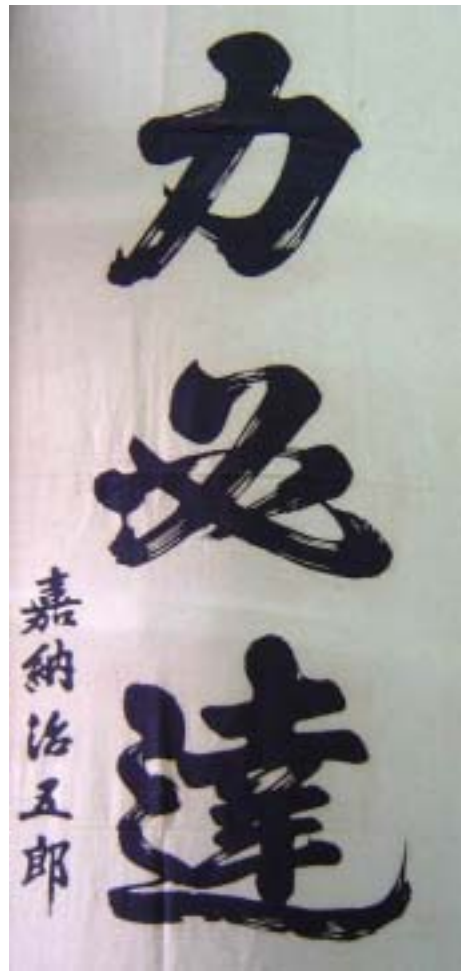
(圖2-6) 嘉納治五郎先生墨寶