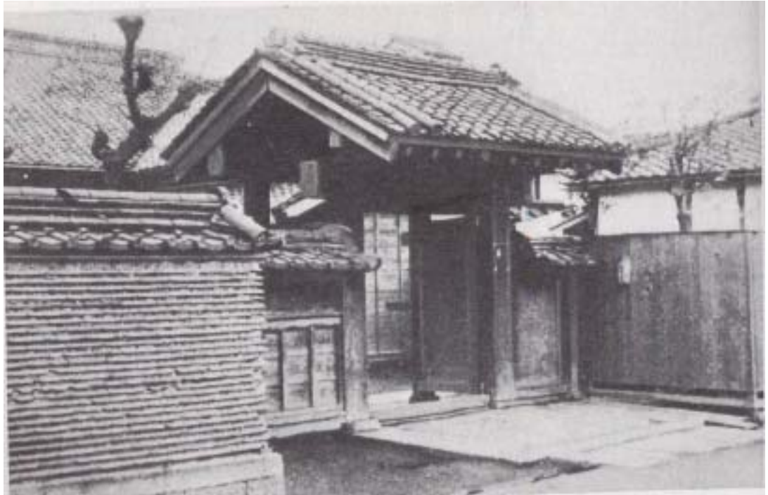
(圖2-2) 講道館創始地永昌寺山門西元1882年(日本明治15年) 資料來源：佐藤宣踐、柏崎克彥【柔道見本】