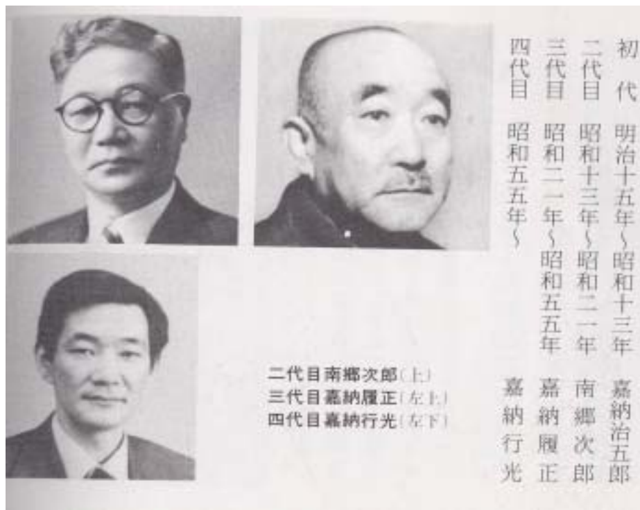
(圖2-7) 講道館歷代館長 資料來源：佐藤宣踐、柏崎克彦【柔道見本】