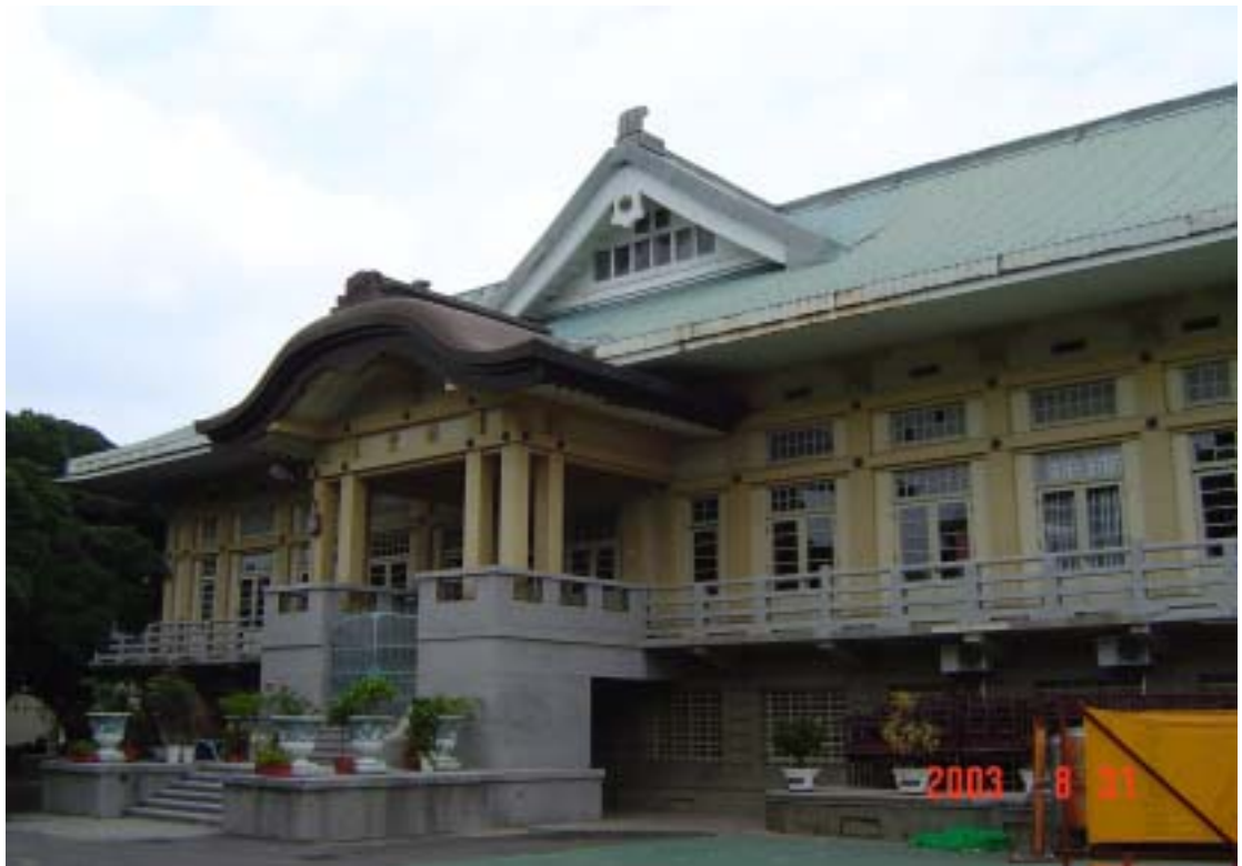
（圖2-8）台灣現存最完整之州武德殿（台南州）位於台南市忠義國小內

在台灣柔道運動發展歷史上，日治時期的柔道發展，扮演著非常重要的角色，因為台灣第一代柔道先進，他們都是在日治時期接受柔道運動訓練，國民政府來台後，成為推展柔道運動的關鍵人物。因此可得知日治時期柔道運動的發展，對目前台灣柔道運動發展有絕對性的關鍵。（註23）