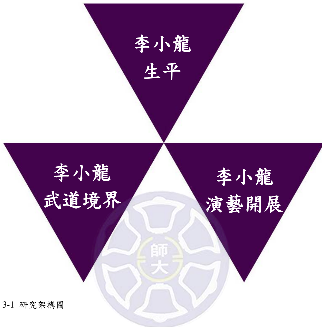
圖 3-1 研究架構圖