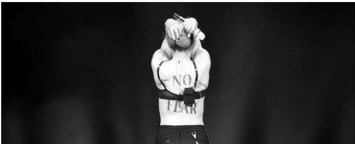
圖 7-1 瑪丹娜 2012 MDNA 世界巡迴演唱會舞台剪影

其實研究者有一個長久以來都很尊敬的偶像，她就是流行樂女皇瑪丹娜。這是瑪丹娜 2012 年第 9 次巡迴演出的台上剪影