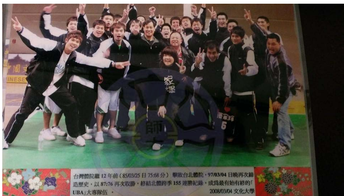
圖 4-2-1 2008 年台體大終止台北體院 13 連霸 155 連勝。

上來，所以印象很深刻就是說當然其他幾個都打得很好，北體那年事實上我看在眼裡是他已經不像過去這麼好的實力了，那大家都很平均實力都很接近，就看臨場的一個演出。(104/04/02)