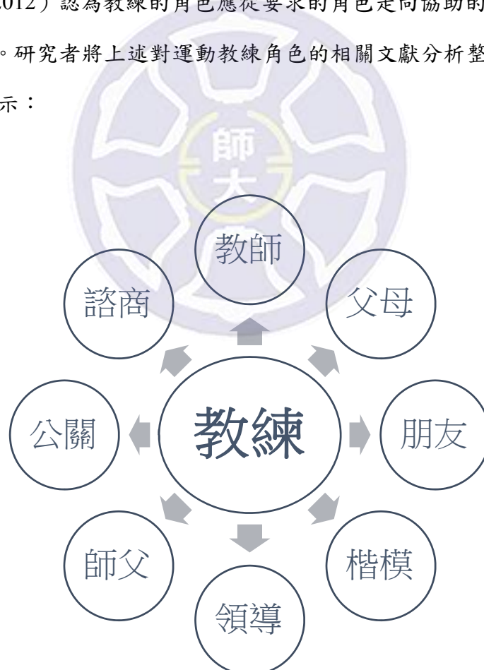
圖2-2-1 教練角色關聯圖

為發揮個人及團隊的能力，在訓練時擬定合理及有效的訓練計劃 他必須是一位領導者；而教練一言一行會影響運動員，他必須是一位模範者；為了教導運動員技術，他必須是一位訓練者。余育蘋（2002）認為，教練是一個個體，教練在團隊中扮演著許多角色：例如父母、領導者、老師、管理者、朋友、溝通者、研究員、諮商員...等。涂國誠（2004）認為運動教練扮演的角色包括：選才星探、訓練指導、教師、家長、教官、朋友、學生、啟發者、規劃者、支持者、新聞公關、經紀公關及社會工作者等角色，運動教練必須付出大量的時間與精力，犧牲許多的個人利益，努力去扮演好各式各樣的角色。林宛曉、季力康（2008）認為運動教練在團隊中一直有著多重的角色（管理、老師），教練的行為會因選手的差異、情境的變化，扮演角色的差異、個人特質不同，而有不同的領導行為表現。張家豪（2012）認為教練的角色應從要求的角色走向協助的角色；從控制的角色走向顧問的角色。研究者將上述對運動教練角色的相關文獻分析整理，繪製教練角色關聯圖，圖2-2-1所示：