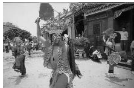
圖 61、各家將團的服裝畫臉不盡相同