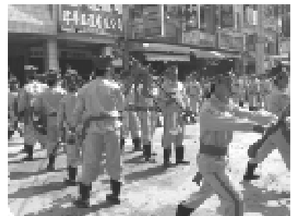
圖 62、宋江陣

「宋江陣」成員人手至少一樣兵器，如大統領宋江的頭旗、副統領玉麒麟盧俊義的雙鋼、黑旋風李逵的雙斧、大刀關勝的大刀、雙劍、雙刀、齊眉棍、板尖、靶仔、金鉤、雙錘、丈二、撻仔刀、斬馬刀、鉤賺鎗等。「宋江陣」的陣型表演配合鑼鼓、銅鈸的音樂節奏作變化。由打圈拜祖師(田都元帥雷海清)開