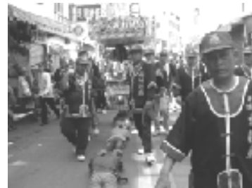
圖 52、神轎隊伍，有信眾俯臥地上讓神轎崇申通過