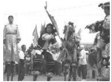
圖 64、高蹺陣

「高蹺陣」一般叫「踏蹺陣」，是以「足膝同綁長木兩支，走路為戲的表演」，「高蹺陣」又「文高蹺」和「武高蹺」兩種，前者著重人物表情的情節表演，動作細膩、唱工講究，有台