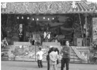
圖 53、酬神廟前戲，以傳統歌仔戲為多