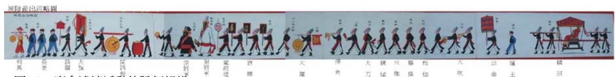
圖 50、廟會遶境活動的隊伍組織

廟會活動是藉神明誕辰、建醮大典、割香（割香：小神明移駕到香火鼎盛的廟內參拜，分享其靈氣、香火氣的參拜活動）等，舉行的慶典祈福活動，慶典活動的同時，也舉行遶境鄉里，有宣揚神威之外，也作驅邪賜福於鄉里百姓的恩典活動，早期農業社會在醫療科技欠缺時代，生命的存活很難找到合理的依據，神明的保佑、懲罰、降災、賜福視為必然，因此百姓視神明廟會是大事。廟會時，