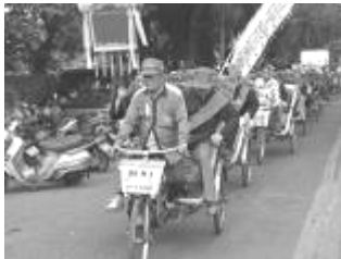
圖 51、長老與關牌，有騎馬有坐車者