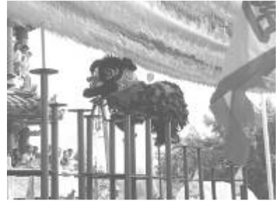
圖 57、醒獅團做跳樁表演

醒獅的色彩鮮豔，造型可愛討喜，其表演又具有「驅邪呈祥」「歡慶佳節」的宗教功能，為廣受人們喜愛的陣頭之一。(黃文博 著2000 台灣民間藝陣 )