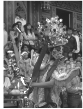
圖 59、八家將

「八家將」是一種嚴肅、震撼與神秘的陣頭，「八家將」以五彩臉譜、錦服、絨頭盔、手持刑具，誇張步伐、神祕的舞蹈肢體動作等，隊伍視覺效果強烈，在現場總是成為人們注視的焦點。盛行於廟會活動並成為迎神廟會重要陣頭。「八家將」也叫「什家將」或「家將團」，宗教角色，是協助緝拿妖魔鬼怪，以七星步、四門陣、八卦陣等等步伐變化、作攻擊和圍捕鬼魂，使鬼魂無所遁形，以求安民保境。