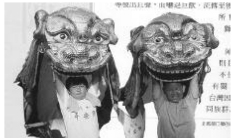
圖 56、獅頭 陳彥仲等 2003 台灣的藝陣

舞獅在台灣鄉城內，每逢春節、慶典、廟會時都會出現，作吉祥、熱鬧場面的表演，台灣民間俗稱「弄獅」，所組成的隊伍就稱為「獅陣」。