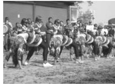
圖 63、跳鼓陣 作穿人表演

「跳鼓陣」是廟會活動最具活力與動感的一支陣頭，有些地方叫「鼓花陣」，也有叫「大鼓弄」或「鼓花陣」。其所指的都是以跳躍