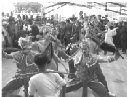
圖 60、什役挑刑具帶頭表演，文差武在前頭