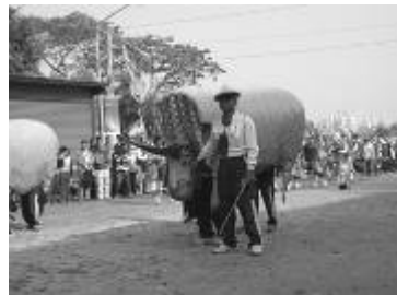
圖 54、趣味陣頭鬥牛陣