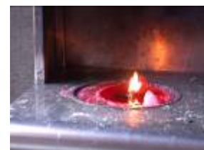
廟門口點香用火燭光

廟會形象要提升，精美文化要保存，除主事者與參與者層次的提高外，政府經費的協助，再透過視覺傳達的美化、包裝、行銷及有效的管理等，讓那微弱將熄的燭光再度火旺起來。